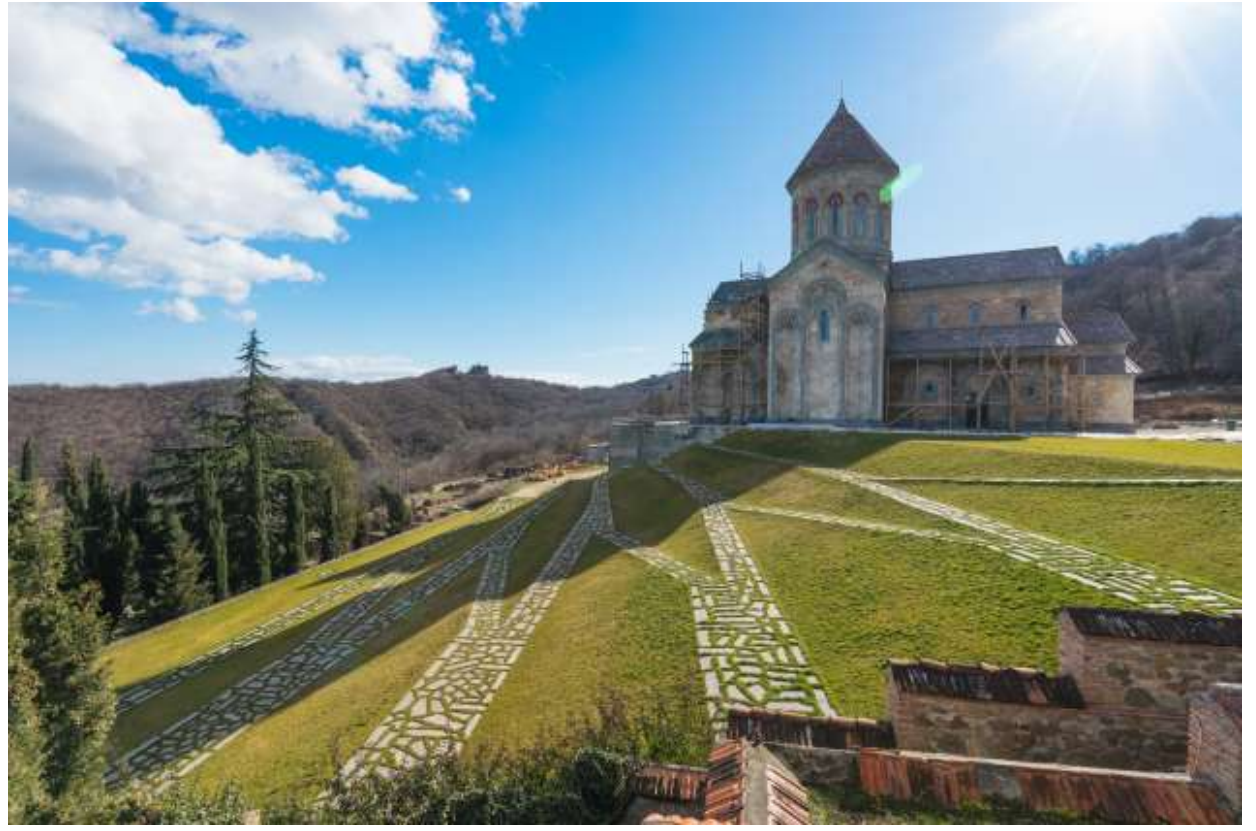
วิหารมากขึ้น วิหารแห่งนี้ได้ชื่อว่าวิหารที่เคยเป็นที่พำนักของร่างองค์เซนต์นินา ศาสดาหญิงผู้เป็นที่เลื่อมใสของชาว

เที่ยง บริการอาหารมื้อกลางวัน ณ ภัตตาคารพิเศษรับประทานอาหารพร้อมชิมไวน์พื้นเมืองอันเลื่องชื่อ บ่าย นำท่านชมสถานที่สำคัญ ของนิกายออร์ทอดอกซ์ Monastery of Saint Nina (วัดนักบุญนินา) ที่ ซิงนากี (Signagi) เป็นหนึ่งในสถานที่สำคัญทางศาสนาและประวัติศาสตร์ของจอร์เจีย ซึ่งมีบทบาทสำคัญในกระบวนการเผยแพร่ศาสนาคริสต์ไปยังประเทศจอร์เจียในศตวรรษที่ 4 วิหารโบราณ อดีตเคยใช้เป็นที่พักของนักแสวงบุญเลื่องชื่อของจอร์เจีย สร้างขึ้นราว ๆ ศตวรรษที่ 9 และมีการใช้ประโยชน์ยาวนานต่อเนื่อง ต่อมาในราว ๆ ศตวรรษที่ 17 ได้มีการต่อเติม