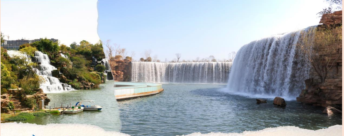
สวนน้ำตกคุนหมิง KUNMING WATERFALL PARK

เช้า 101 รับประทานอาหารเช้า ณ ห้องอาหารของโรงแรม (มื้อที่ 1) จากนั้นนำท่านชมความงามและอลังการของ สวนน้ำตกคุนหมิง (KUNMING WATERFALL PARK) สวนสาธารณะใจกลางเมืองคุนหมิงแห่งนี้เปิดให้บริการเมื่อปี 2016 ถือเป็นสถานที่ท่องเที่ยวแห่งใหม่และเป็นที่พักผ่อนหย่อนใจยอดนิยมของชาวเมืองคุนหมิงเป็นสวนสาธารณะขนาดใหญ่ที่ใช้เวลาสร้างกว่า 3 ปี ภายในประกอบไปด้วยน้ำตกและทะเลสาบอีก 2 แห่ง ที่สร้างขึ้นด้วยฝีมือมนุษย์ ไฮไลต์ของสวนอย่าง น้ำตกใหญ่ยักษ์นั้น กว้างกว่า 400 เมตร และมีความสูงถึง 12.5 เมตร ถือเป็นน้ำตกฝีมือมนุษย์ที่ยาวติดอันดับของเอเชียเบื้องล่าง น้ำตกคุนหมิง เป็นทะเลสาบที่มีทางเดินพาดอยู่