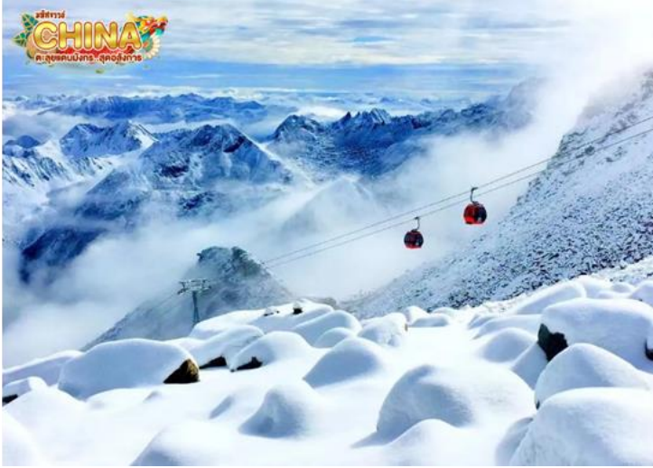
(หมายเหตุ: ปริมาณหิมะขึ้นอยู่กับสภาพอากาศ)