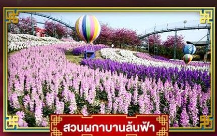
สวนภูพานล้นฟ้า