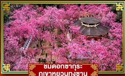
ชมดอกซากุระภูเขาหยวนทงซาน