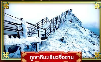
ภูเขาหิมะเจียวจื่อซาน