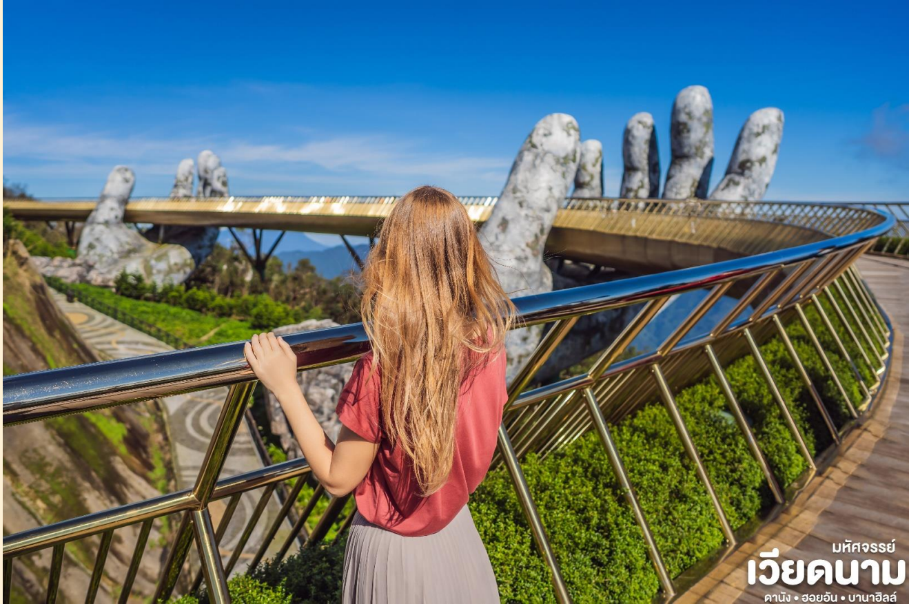
แพ็คเกจวีคเดย์ เวียดนาม ดานัง • ฮอยอัน • บานาฮิลล์