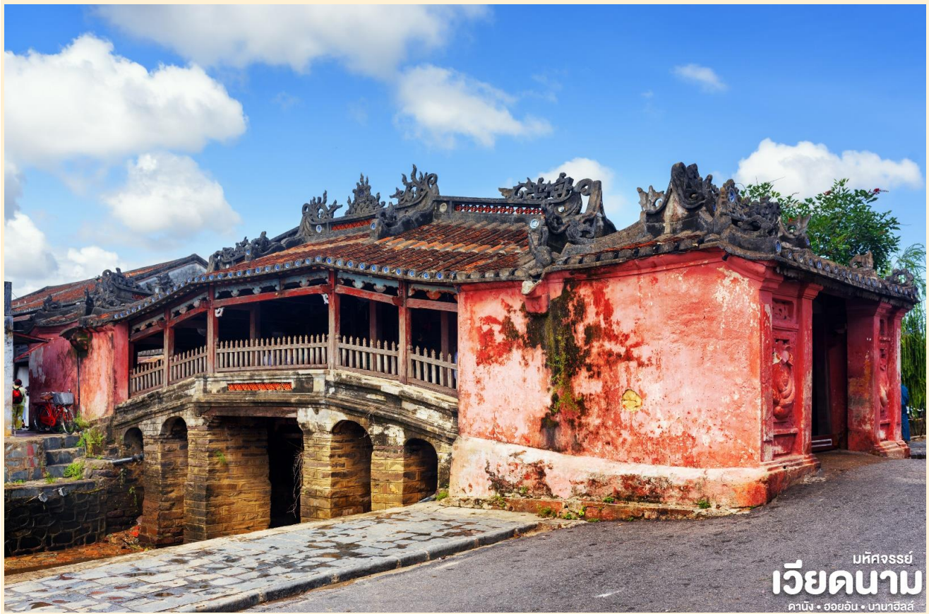
มัททวรัย เวียดนาม ดานัง • ฮอยอัน • บานาฮิลล์

นำชม Old House of Tan Skyบ้านโบราณ ซึ่งเป็นชื่อเจ้าของบ้านเดิมชาวเวียดนามที่มีฐานะดี ชมบ้านไม้ที่เก่าแก่และสวยงามที่สุดของเมืองฮอยอัน สร้างมากกว่า 200 ปี ปัจจุบันได้รับการอนุรักษ์ไว้เป็นอย่างดี การออกแบบตัวอาคารเป็นการผสมผสานระหว่างอิทธิพลทางสถาปัตยกรรมของจีน ญี่ปุ่น และเวียดนาม ด้านหน้าอาคารติดถนนเหวียนไทฮ็อกทำเป็นร้านบูติก ด้านหลังติดถนนอีกสายหนึ่งใกล้แม่น้ำทูโบนมีประตูออกไม้ สามารถชมวิวทิวทัศน์และเห็นเรือพายสัญจรไปมาในแม่น้ำทูโบนได้เป็นอย่างดี นำชม สะพานญี่ปุ่น ซึ่งสร้างโดยชุมชนชาวญี่ปุ่นเมื่อ 400 กว่าปีมาแล้ว กลางสะพานมีศาลเจ้าศักดิ์สิทธิ์ ที่สร้างขึ้นเพื่อสวดส่งวิญญาณมังกร ชม ศาลกวนอู ซึ่งอยู่บนสะพานญี่ปุ่นและที่ฮอยอันชาวบ้านจะนำสินค้าต่าง ๆ ไว้ที่หน้าบ้าน เพื่อขายให้แก่นักท่องเที่ยวท่านสามารถซื้อของที่ระลึก เป็นของฝากกลับบ้านได้อีกด้วย เช่น กระเป๋าโคมไฟ เป็นต้น