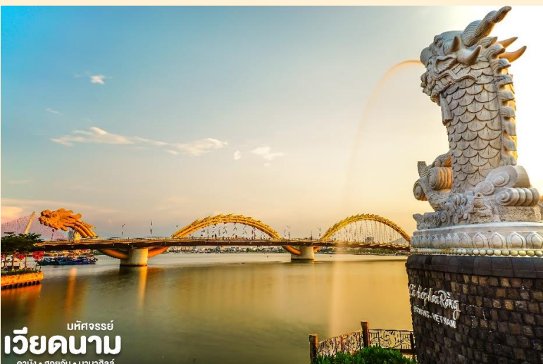
มหัศจรรย์ เวียดนาม ดานัง • ฮอยอัน • บานาฮิลล์

BT-DAD68_FD_12-15 APR 2025 & 13-16 APR 2025 DANANG HOIAN BANAHILLS (พักบานาฮิลล์)