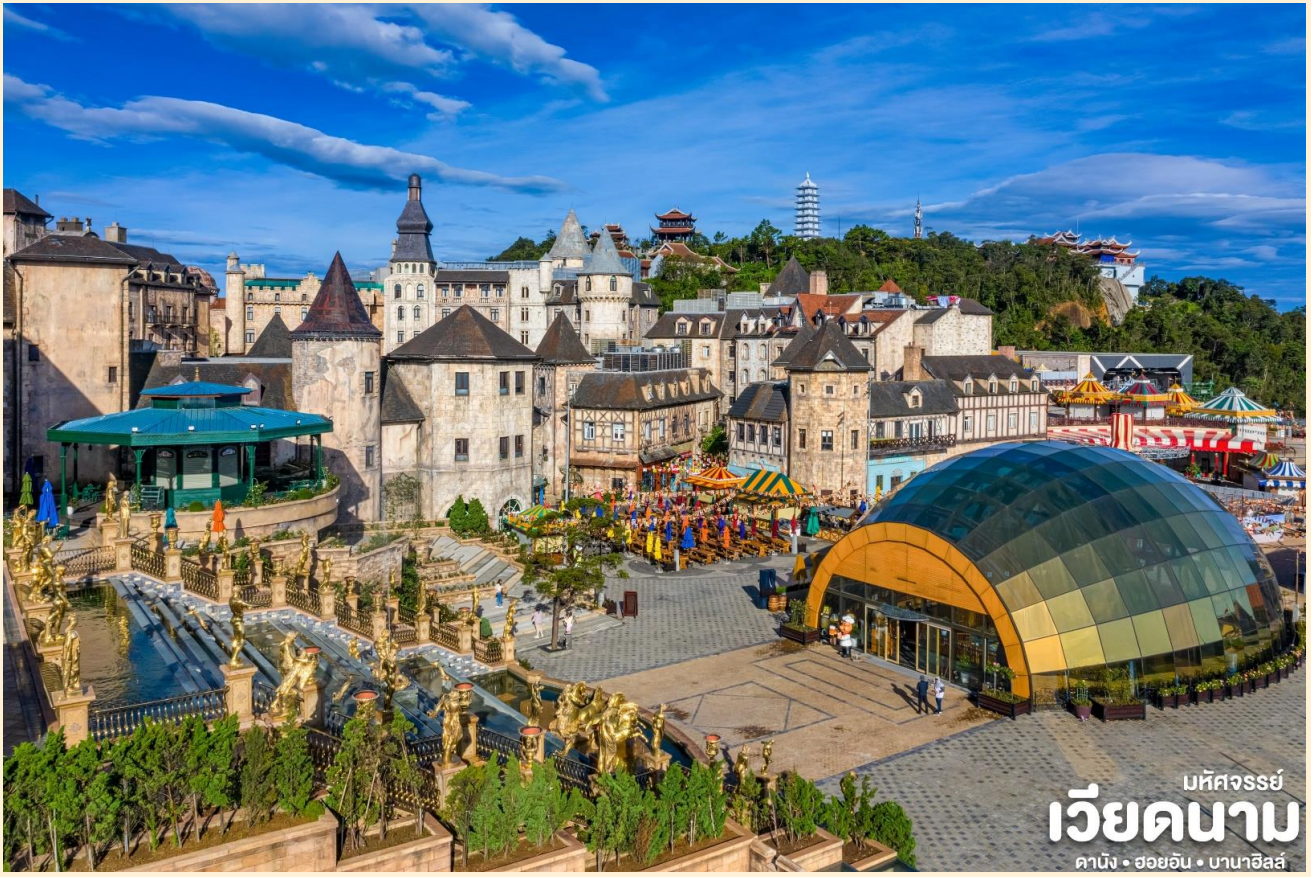
มทศจรรย เวียดนาม ดานัง • ฮอยอัน • บานาฮิลล์

เช้า 101 บริการอาหารเช้า ณ ห้องอาหารของโรงแรม จากนั้น นำทุกท่านเดินทางสู่ บานาฮิลล์ เป็นที่ตากอากาศที่ดีที่สุดในเวียดนามกลางได้ค้นพบในสมัยที่ฝรั่งเศสเข้ามาปกครองเวียดนามได้มีการสร้างถนนอ้อมขึ้นไปบนภูเขาสร้างที่พักโรงแรมสิ่งอำนวยความสะดวกต่างๆเพื่อใช้เป็นสถานที่พักผ่อนในระหว่างการบรรจบที่นั่งกระเช้าด้วยความเสียวพร้อมความสวยงามเราจะได้เห็นวิวธรรมชาติทั้งน้ำตก Toc Tienและลำธาร Suoi no (ในฝัน)