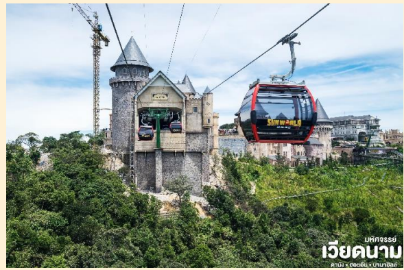
แพ็คเกจวีคเดย์ เวียดนาม

นำท่าน นั่งกระเช้าขึ้นสู่บานาฮิลล์ กระเช้าแห่งบานาฮิลล์นี้ได้รับการบันทึกสถิติโลกโดย World Record ว่าเป็นกระเช้าไฟฟ้าที่ยาวที่สุดประเภท Non Stop โดยไม่หยุดแวะมีความยาวทั้งสิ้น 5,042 เมตรและเป็นกระเช้าที่สูงที่สุดที่ 1,294 เมตรนักท่องเที่ยวจะได้สัมผัสปุยมะหมอกและบางจุดมีเมฆลอยต่ำกว่ากระเช้า พร้อมอากาศบริสุทธิ์อันสดชื่นจนทำให้ท่านอาจลืมไปเสียด้วยซ้ำว่าที่นี่ไม่ใช่ยุโรปเพราะอากาศที่หนาวเย็นเฉลี่ยตลอดทั้งปีประมาณ 10 องศาเท่านั้น จุดที่สูงที่สุดของบานาฮิลล์มีความสูง 1,467 เมตรกับสภาพผืนป่าที่อุดมสมบูรณ์