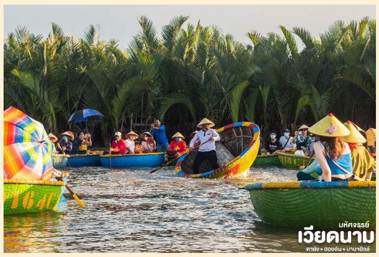
มัทศจรรย์ เวียดนาม ดานัง • ฮอยอัน • บานาฮิลล์

จากนั้น นำท่านเดินทางสู่ หมู่บ้านกิมทาน สนุกสนานไปกับกิจกรรม!! นั่งเรือกระดัง Cam Thanh Water Coconut Village หมู่บ้านเล็กๆ ในเมืองฮอยอันตั้งอยู่ในสวนมะพร้าวริมแม่น้ำ ในอดีตช่วงสงครามที่นี่เป็นที่พักอาศัยของเหล่าทหาร อาชีพหลักของคนที่นี่คืออาชีพประมง ระหว่างการ