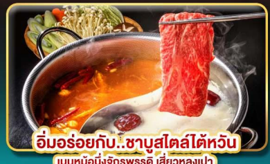
อิ่มอร่อยกับ..ชาบูสไตส์ไต้หวัน เมนูหม้อหนึ่งจักรพรรดิ เสี่ยวหลงเปา

ช้อปปิ้งจุใจ..ตลาดซีเหมินติง ตลาดโรงจิ้งในท์มาร์เก็ต ตลาดเหล่าเหลอในท์มาร์เก็ต