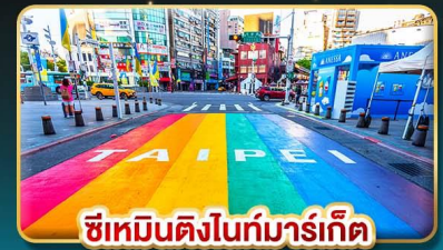
ซีเหมินติงในท์มาร์เก็ต