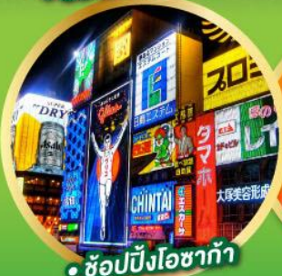
• ช้อปปิ้งโอซาก้า

• ชมความงามของกำแพงหิมะ เส้นทางสายอัลไพน์ทาเคยาม่า (Japan Alps Snow wall)