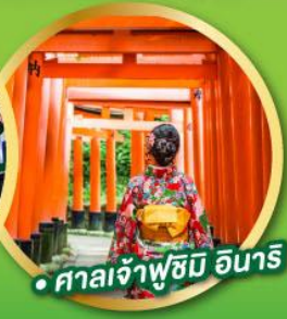
• ศาลเจ้าฟูชิมิ อินาริ