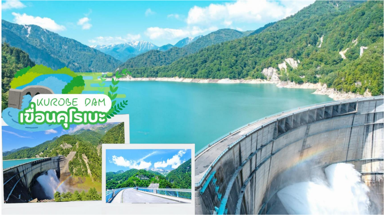
KUROBE DAM เขื่อนคุโรเบะ