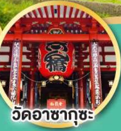
วัดอาซากุสะ