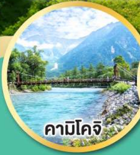
คามิโคจิ

สัมผัสความมหัศจรรย์อากาศ พร้อมชมวิวแบบ 360 องศา คามิโคจิสวรรค์บนดินแห่งเทือกเขาแอลป์ เที่ยวเต็มทุกวันไม่มีฟรีคีย์ พักโรงแรมออนเซ็น 2 คืน พักโตเกียว 1 คืน