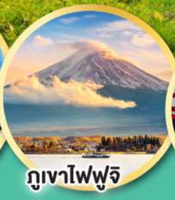
ภูเขาไฟฟูจิ