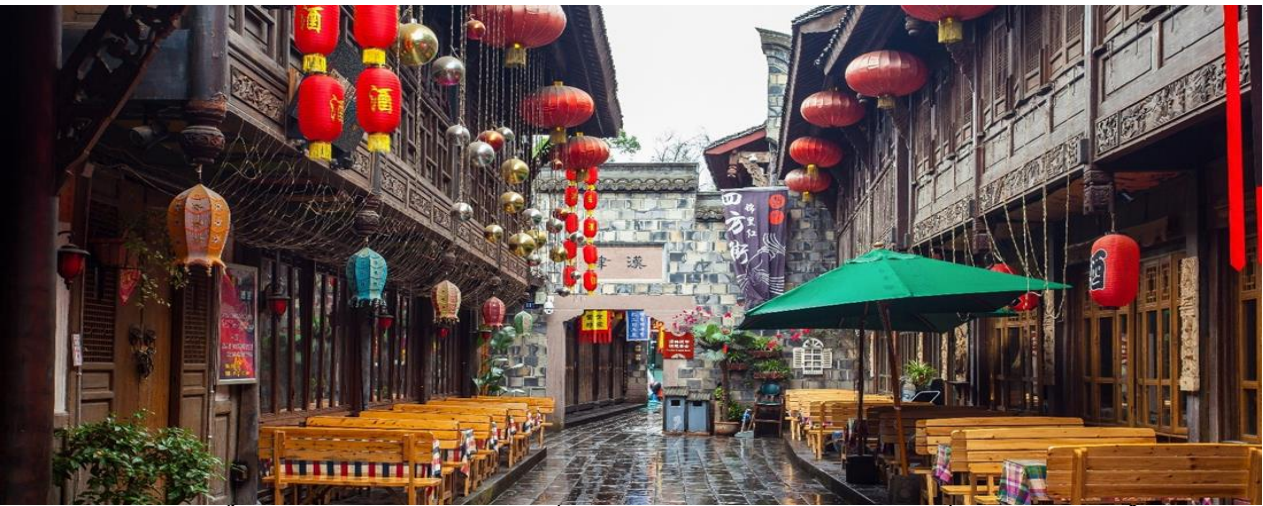
จากนั้นนำท่านสักการะ วัดต้าฉือ ซึ่งอยู่บริเวณติดกันกับถนนไท่กุ่ทสี่ ซึ่งวัดเก่าแก่แห่งนี้แต่เดิมพระถึงข้าจึงเคยจำพรรษาก่อนเดินทางไปชมพูทวีป