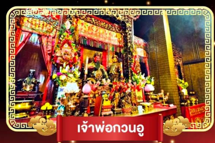
เจ้าพ่อกวนอู