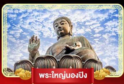
พระใหญ่นองปิง

ฟรีเปิดท้องพระคลังเจ้าแม่กวนอิม บินลัดฟ้าไปบูชาเกาะฮ่องกง