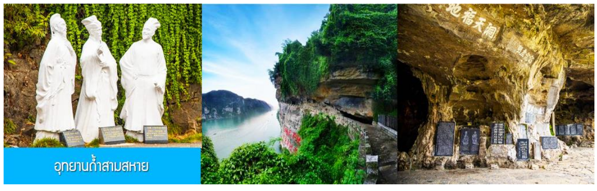
อุทยานถ้ำสามสหาย