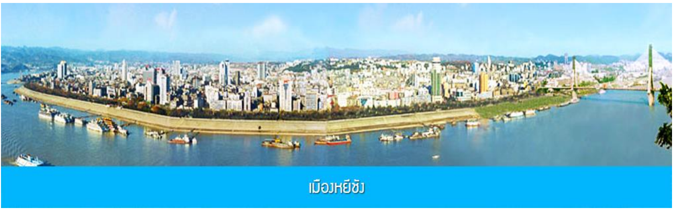
เมืองหยี้ชัง