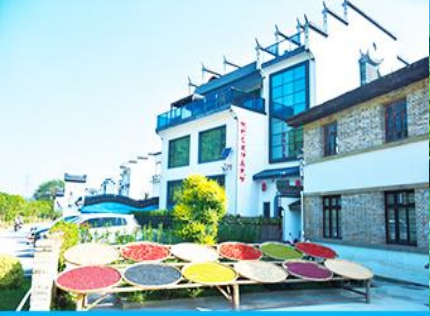
หมู่บ้านโบราณ ลือเหมินซุน