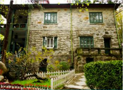
เรือนรับรอง หม่ยหลู