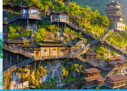
อุทยาน วังเซียนกู่