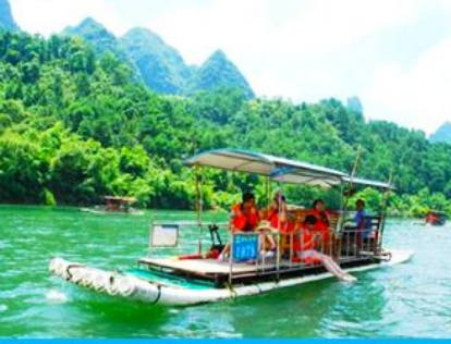
ล่องแพไม้ไผ่