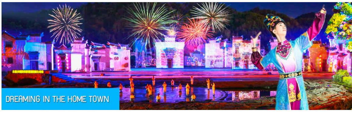
DREAMING IN THE HOME TOWN

หลังอาหารนำท่านเดินทางเข้าที่พัก หรือท่านสามารถเลือกซื้อโปรแกรมเสริม เป็นบัตรชมการแสดง ชุด DREAMING IN THE HOME TOWN เป็นการแสดงบนเวทีขนาดใหญ่ที่จัดสร้างขึ้นกลางแจ้ง ท่ามกลางธรรมชาติที่มีภูเขาเป็นฉากหลัง ใช้ทุนสร้างกว่า 280 ล้านบาท เป็นการแสดงที่น่าดูชมที่สุดในมณฑลเจียงซี แต่ละครจากการแสดงมีการออกแบบเวที ฉากประกอบที่พิถีพิถัน ประณีต และอลังการ ใช้ทีมงานนักแสดงหลายร้อยคน และระบบแสง สี เสียงที่ทันสมัยประกอบในการแสดง