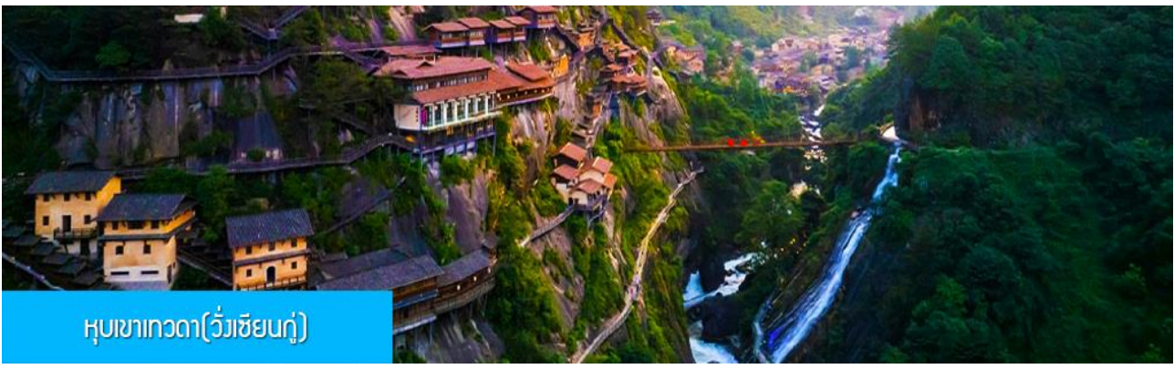
หุบเขาเทวดา(วังเซียนกู่)

เที่ยง รับประทานอาหารกลางวัน ณ ภัตตาคาร หลังอาหารเช้าท่านเดินทางสู่เมือง ซังเหรา 上饶 (ระยะทาง 127 กม. ใช้เวลาเดินทางโดยรถบัสราว 2 ชั่วโมง)