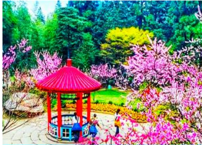
สวนฮวาจิ้ง