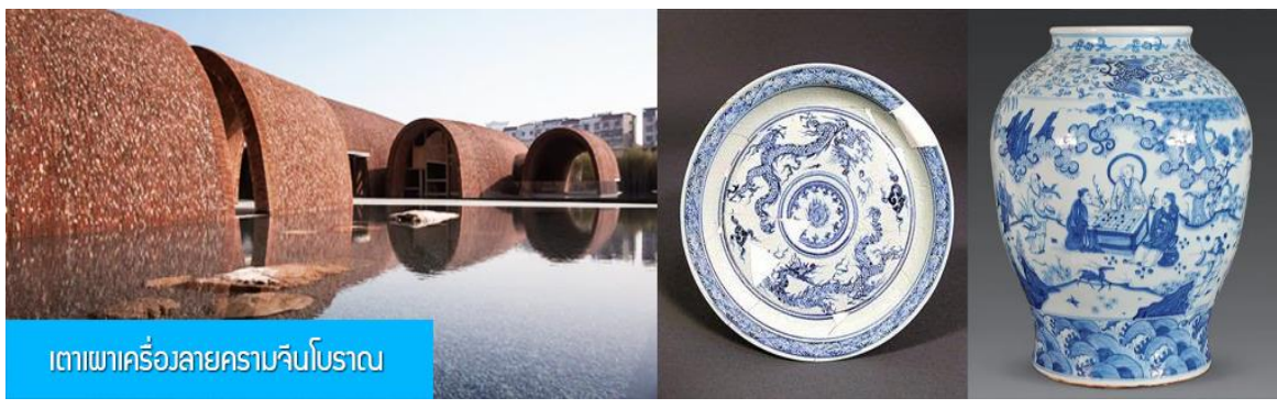
เตาเผาเครื่องลายครามจีนโบราณ

หลังอาหารนำท่านชม เตาเผาเครื่องลายครามจีนโบราณ 景德镇官窑 เป็นโรงงานผลิตเครื่องลายครามจีนโบราณที่ผลิตเครื่องใช้ต่าง ๆ (เครื่องลายคราม) อาทิ แจกันประดับบ้าน ถ้วยชาม บรรจุภัณฑ์ที่ใช้ในบ้าน เพื่อส่งถวายให้เป็นเครื่องใช้ในวังสำหรับจักรพรรดิ และพระบรมวงศานุวงศ์ เครื่องลายครามที่ผลิตจากโรงงานแห่งนี้ได้ชื่อว่าเป็นเครื่องลายครามที่ดีที่สุดในพื้นที่จีน ซึ่งของที่ผลิตได้ทุกชิ้นหลังผ่านการคัดกรองแล้วจะถูกส่งไป ในพระราชวังที่กรุงปักกิ่ง ส่วนที่เหลือจากการคัดกรองจะถูกพบให้แตกและนำมาเผาใหม่ โดยไม่สามารถนำไปขายให้กับสามัญชนทั่วไปได้.....นำท่านชมเตาเผาโบราณ และเครื่องลายครามโบราณรุ่นต่าง ๆ ซึ่งบางส่วนยังคงถูกเก็บรักษาไว้เป็นอย่างดี