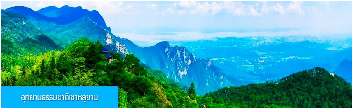
อุทยานธรรมชาติเขาหลูซาน