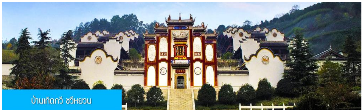
บ้านเกิดกวี ขวี่หยวน