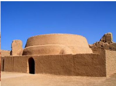
เมืองโบราณกาซางอูเจี