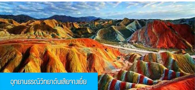
อุทยานธรณีวิทยาตันเสียวายี

วันที่สอง เมืองหลันโจว – นั่งรถไฟความเร็วสูงสู่เมืองจางเยี่ย – เที่ยวชมอุทยานธรณีวิทยาตันเสียวายี (ภูเขาสายรุ้ง)