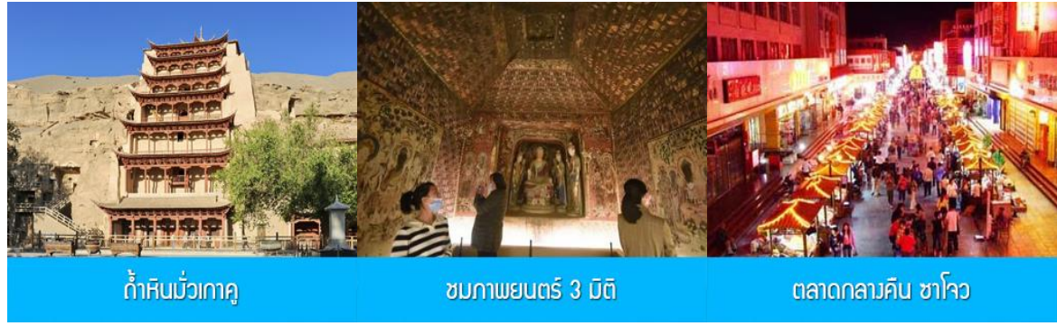
ถ้ำหินมั่วเกาคุ

พักที่ REZEN HOTEL ระดับ 4 ดาวท้องถิ่นหรือเทียบเท่าในเมือง เจียวกวน