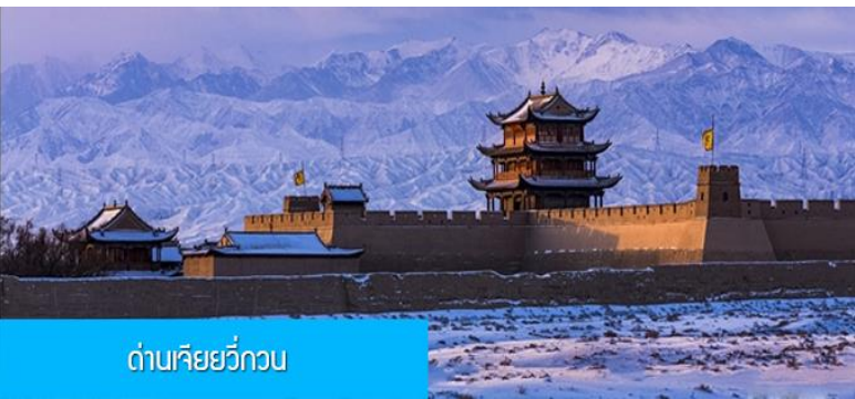
ด่านเจี๋ยวีกวน