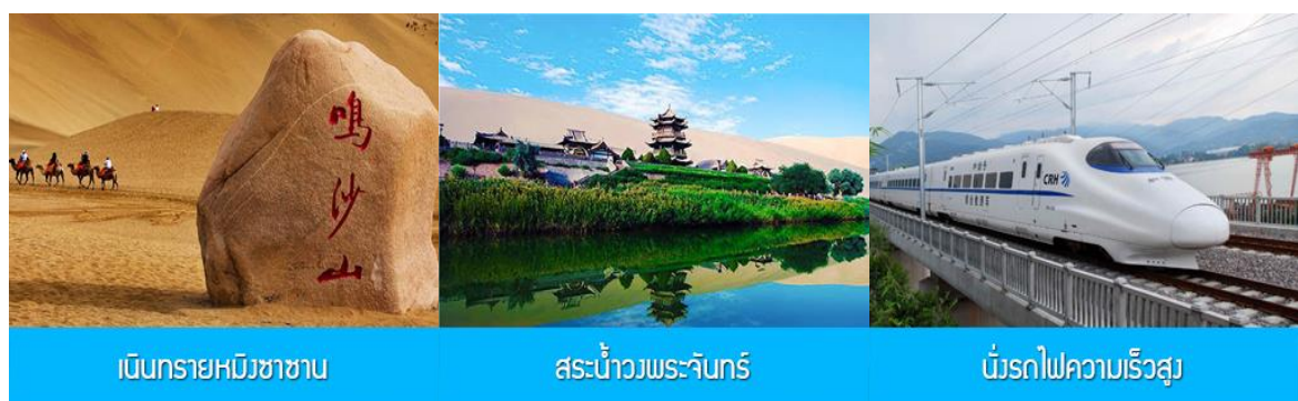
เป็นทรายหมีซาซา

ค่ำ รับประทานอาหารค่ำ ณ ภัตตาคาร พักที่ METRO PARK HOTEL โรงแรมระดับ 4 ดาวท้องถิ่นหรือเทียบเท่าในเมืองตุนหวง หลังอาหารให้ท่าน มีเวลาเดินเล่น ช้อปปิ้งใน ตลาดกลางคืน ซาโจว 沙洲夜市 ให้ท่านเลือกซื้อของที่ระลึกของเส้นทางสายไหมได้ตามอัธยาศัย