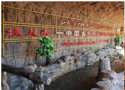
ระบบชลประทานอู่หลู่ฟาน

ค่ำ รับประทานอาหารค่ำ ณ ภัตตาคาร พักที่ HAMPTON BY HILTON HOTEL โรงแรมระดับ 4 ดาวหรือเทียบเท่าในเมืองอู่หลู่ฟาน