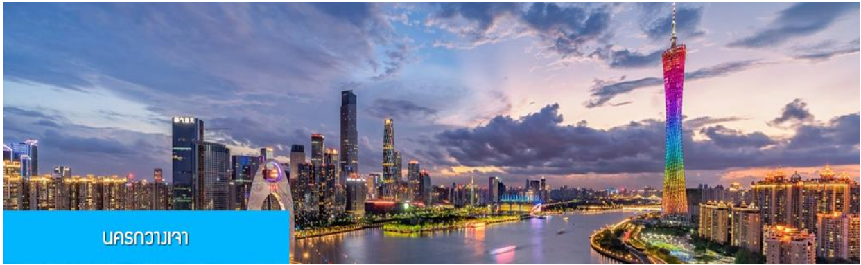
นครกวางเจา