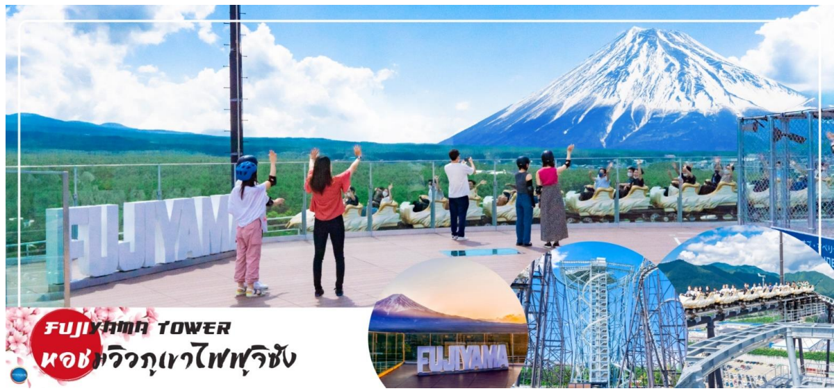
ฟูจิยามา TOWER หอชมวิวภูเขาไฟฟูจิ

ได้เวลาอันสมควรนำท่านเดินทางสู่ เมืองนาริตะ (Narita) (ใช้เวลาเดินทางประมาณ 2.30 ชั่วโมง) นำท่านเดินทางสู่ อโชน มอลล์ นาริตะ (Aeon Narita Mall) ห้างสรรพสินค้าที่นิยมในหมู่นักท่องเที่ยวชาวต่างชาติ เนื่องจากตั้งอยู่ใกล้กับสนามบินนานาชาตินาริตะ ภายในตกแต่งในรูปแบบที่ทันสมัยสไตล์ญี่ปุ่น มีร้านค้าที่หลากหลายมากกว่า 150 ร้านจำหน่ายสินค้าแฟชั่น อาหารสดใหม่ และอุปกรณ์ภายในบ้าน นอกจากนี้ยังมีร้านเสื้อผ้าแฟชั่นมากมาย เช่น MUJI, 100 yen shop, Sanrio store, Capcom games arcade และซูปเปอร์มาร์เก็ตขนาดใหญ่