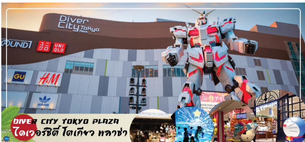
DIVER CITY TOKYO PLAZA ไดเวอร์ซิตี โตเกียว พลาซ่า

เช้า รับประทานอาหารเช้า ณ ห้องอาหารของโรงแรม (5) เดินทางสู่ โตเกียว (Tokyo) (ใช้เวลาเดินทางโดยประมาณ 1 ชั่วโมง) เดินทางสู่ ศาลเจ้าคามะโตะ เทนจิน(Kameido Tenjin Shrine) เป็นศาลเจ้าเก่าแก่ที่เป็นหนึ่งในแลนด์มาร์คของโตเกียว มีความโดดเด่นที่สะพานโค้งสีแดงกลางสระน้ำ และยังเป็นจุดชมดอกวิสทีเรียชื่อดังเพียงแห่งเดียวของเมืองด้วยศาลเจ้าคามะโตะเทนจิน หรือ Kameido Tenjinsha เป็นศาลเจ้าที่สร้างขึ้นเพื่ออุทิศให้กับนักปราชญ์ชื่อดังตั้งแต่ศตวรรษที่ 9 ของญี่ปุ่นที่ชื่อว่า Sugawara no Michizane สร้างขึ้นเมื่อปี 1662 ซึ่งเป็นสถานที่ยอดนิยมของชาวโตเกียวในการมาสักการะ ท่าน Michizane มาตั้งแต่ยุคเอโดะจนถึงปัจจุบัน (จุดชมดอกวิสทีเรียขึ้นอยู่กับสภาพอากาศ) เดินทางสู่ ย่านโอไดบะ (Odaiba) เมืองคือเกาะที่สร้างขึ้นไว้เป็นแหล่งช้อปปิ้ง และแหล่งบันเทิงต่างๆ ในอ่าวโตเกียว ได้รับการปรับปรุงให้มีชื่อเสียงและเป็นที่ยอมรับในช่วงหลังของปี 1990 นอกจากนี้มีสถาปัตยกรรมที่สวยงามตั้งอยู่มากมายแล้ว แต่ก็ยังคงความเป็นธรรมชาติไว้ด้วยความอุดมสมบูรณ์ของพื้นที่สีเขียว ไดเวอร์ซิตี โตเกียว พลาซ่า (Diver City Tokyo Plaza) เป็นห้างดังอีกห้างหนึ่ง ที่อยู่บนเกาะ โอไดบะ จุดเด่นของห้างนี้ก็คือ หุ่นยนต์กันดั้ม ขนาดเท่าของจริง ซึ่งมีขนาดใหญ่มาก ในบริเวณห้าง อีสระช้อปปิ้งตามอัธยาศัย