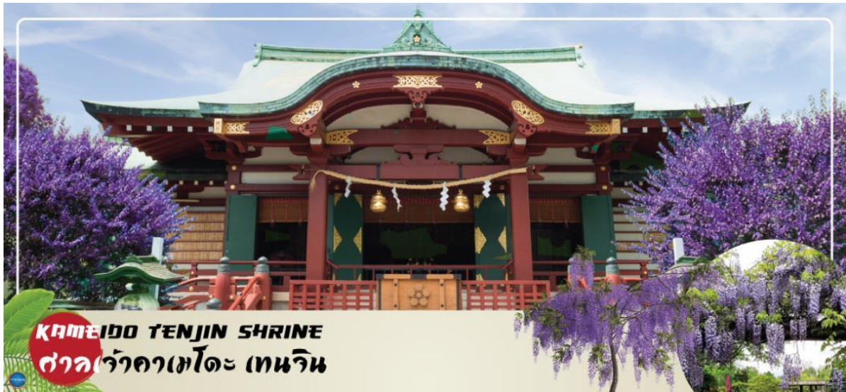
KAMEIDO TENJIN SHRINE ศาลเจ้าคามะโตะ เทนจิน

วันที่สี่ กรุงเทพฯ – ศาลเจ้าคามะโตะ เทนจิน (จุดชมดอกวิสทีเรียขึ้นอยู่กับสภาพอากาศ) – ย่านโอไดบะ – ห้างไดเวอร์ซิตี – ชมแมวยักษ์ 3 มิติ พร้อมช้อปปิ้ง ย่านชินจูกุ – เมืองนาริตะ