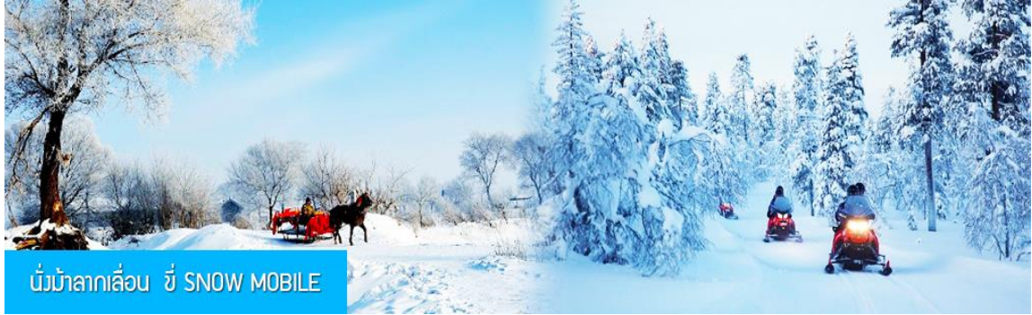
นั่งม้าลากเลื่อน ชီး SNOW MOBILE

หมายเหตุ การเดินทางเที่ยวชมอุทยานทำได้ด้วยการเดินเท้า เข้าและออกจากอุทยานซึ่งจะใช้เวลาขาไป 40 นาที ขากลับ 40 นาที ระหว่างทางต้องลุยหิมะแต่สามารถชมและถ่ายภาพวิวหิมะได้ตลอดทาง และท่านสามารถ เลือกซื้อ OPTION เสริมที่ 1 ด้วยการนั่งม้าลากเลื่อน 1 ขา 马拉雪橇 (ใช้เวลา 15 นาทีอัตราค่าบริการท่านละ 240 หยวนหรือ 1,200 บาทต่อเที่ยว) หรือเลือกซื้อ OPTION เสริมที่ 2 ด้วยการขี่ SNOW MOBILE 1 ขา 雪地摩托车 (ใช้เวลา 10 นาทีอัตราค่าบริการท่านละ 300 หยวนหรือ 1,500 บาทต่อเที่ยว) หมายเหตุ โปรแกรมเสริมเป็นโปรแกรมที่ท่านต้องเสียค่าใช้จ่ายเองด้วยความสมัครใจ สำหรับท่านที่ไม่ต้องการเลือกซื้อกิจกรรมดังกล่าวสามารถเลือกวิธีเดินเท้าเข้า ชมและออกจากอุทยานได้