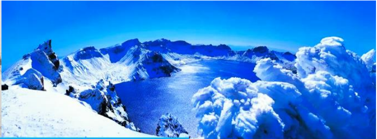
อุทยานทอเทียวธรรมชาติจางไปซาน