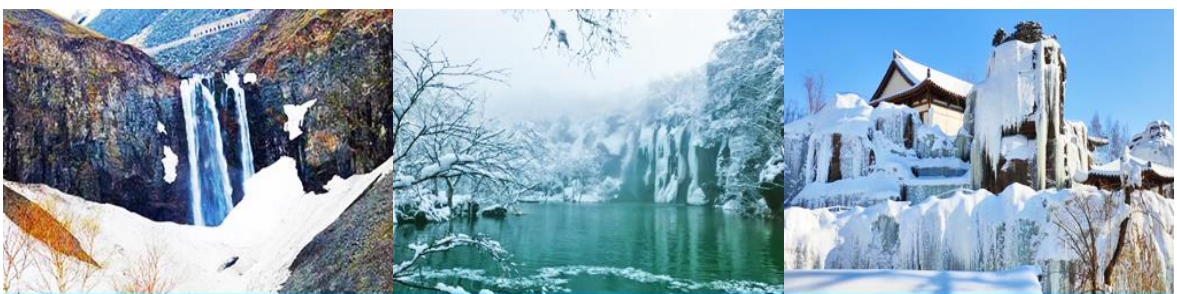
น้ำตกฉางไป๋ซาน

พักที่ QIUSHA MEISHU HOTEL โรงแรมระดับ 4 ดาวห้องถิ่นหรือเทียบเท่า ในเมืองฉางไป๋ซาน