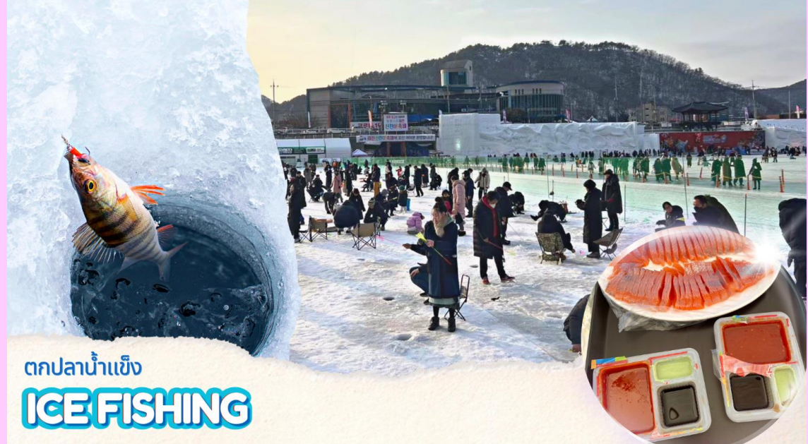
ตกปลาน้ำแข็ง ICE FISHING

(**รวมอุปกรณ์ตกปลาแบบเบสิค**) วิธีการตกปลา คือ หย่อนเหยื่อปลอม (ที่ทางเทศบาลเตรียมไว้ให้) ลงไปในรู จากนั้นก็กระตุกไม้เบ็ดตกปลาเบาๆ ให้เหมือนเหยื่อกำลังลอยไปลอยมาในน้ำ และปลาก็จะเข้ามากินเหยื่อ ง่ายๆเพียงแค่นี้ก็ทำให้ท่านตกปลาได้อย่างสนุกสนาน )