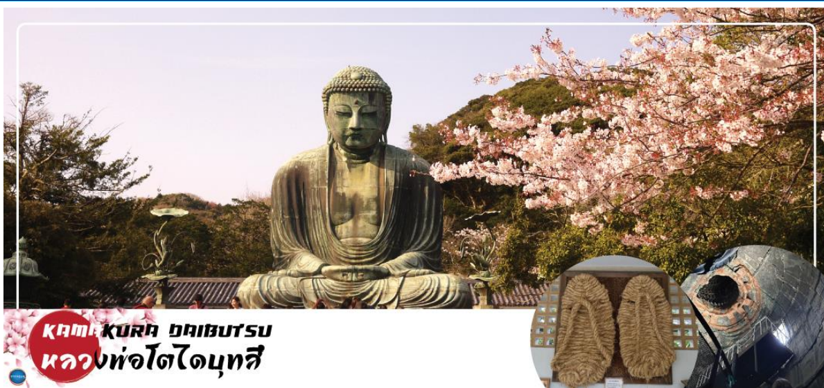
Kamakura Daibutsu หลวงพ่อดาโบตสึ

07.55 น. เดินทางถึง ท่าอากาศยานนานาชาตินาริตะ ประเทศญี่ปุ่น นำท่านผ่านขั้นตอนการตรวจคนเข้าเมืองและศุลกากร เรียบร้อยแล้ว (เวลาที่ญี่ปุ่น เร็วกว่าเมืองไทย 2 ชั่วโมง กรุณาปรับนาฬิกาของท่านเพื่อความสะดวกในการนัดหมายเวลา) ***สำคัญมาก!! ประเทศญี่ปุ่นไม่อนุญาตให้นำอาหารสด จำพวก เนื้อสัตว์ พืช ผัก ผลไม้ เข้าประเทศ หากฝ่าฝืนมีโทษปรับและจับ