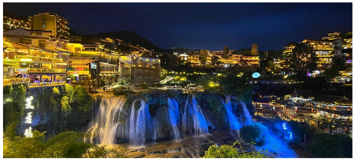
ที่พัก JUN YA HOTEL FURONG ระดับ 4 ดาวหรือเทียบเท่า (ที่พักอยู่ด้านนอกหมู่บ้าน)

อิสระเที่ยวชมบรรยากาศอันสวยงามในยามค่ำคืนเมื่อแสงไฟประดับประดาส่องสว่างไปทั่วหมู่บ้าน