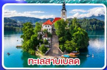
ทะเลสาบเบลด

ตามรอย Game of thrones ณ เมืองดูบรอฟนิก ไข่มุกแห่งอาครีตีก พร้อมขึ้นกระเช้า SRD