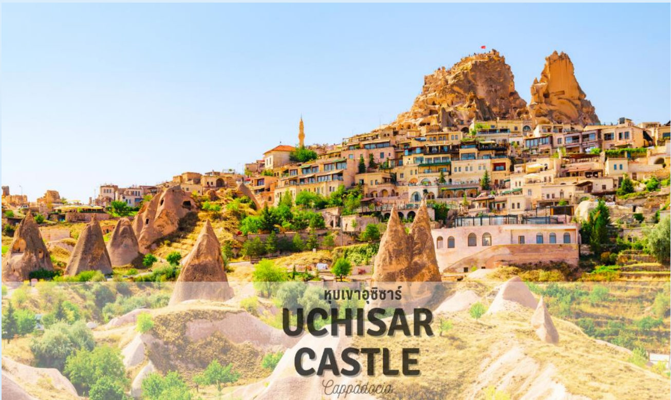
หุบเขาอุชิซาร์ UCHISAR CASTLE Cappadocia

แวะถ่ายรูป หุบเขาอุชิซาร์ (UCHISAR VALLEY) หุบเขาคัลายจอมปลวกขนาดใหญ่ ใช้เป็นที่อยู่อาศัย ซึ่งหุบเขา ดังกล่าวมีรูพรุน มีรอยเจาะ รอยซุด อันเกิดจากฝีมือมนุษย์ไปเกือบทั่วทั้งภูเขา เพื่อเอาไว้เป็นที่อยู่อาศัย