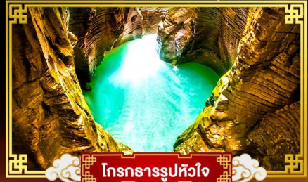
โตรถารรูปหัวใจ