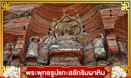
พระพุทธรูปแกะสลักหินผากิน