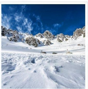
กระเช้าลอยฟ้าโคมากะทาเกะ