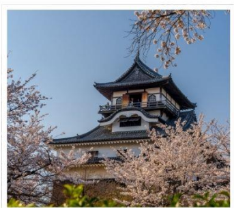
ปราสาทอิบุยามะ