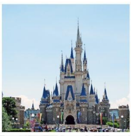
โตเกียว ดิสนีย์แลนด์