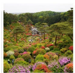
วัดชิโอะฟูเนะ คันนงจิ

โตเกียวดิสนีย์แลนด์ ดินแดนในฝันของคนทั้งโลก อานาโมโมะ โนะ ซาโตะ ดอกท้อกลางหุบเขาที่รอคุณมาเยือน ทางรถไฟสายเก่า เคอะเกะ อินโคลน์ 1 ในจุดชมซากุระที่สวยงามที่สุดแห่งเกียวโต ขึ้นกระเช้าที่สูงที่สุดในญี่ปุ่น โคมากะทาเกะ ขับแข่งเทือกเขาสุดอัศจรรย์เซ็นโจจิกิ เซอร์ก ปราสาทอิบุยามะ 1 ใน 12 ปราสาทดั้งเดิมกับทิวทัศน์อันแสนสวยงาม ชิโอะฟูเนะ คันนงจิ วัดแห่งดอกไม้สุด unseen ที่ไม่ควรพลาด พักออนเซ็น 2 คืน!!! // อาหารพิเศษ...บุฟเฟ่ต์ปิ้งย่าง, บุฟเฟ่ต์ชาบู, บุฟเฟ่ต์ชาบู กรุ๊ปสบายๆ เพียง 20 ท่านเท่านั้น!!!