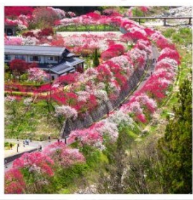
สวนอานาโมโมะ โนะ ซาโตะ