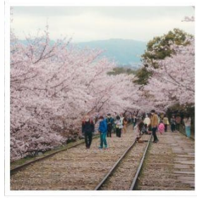
เคอะเกะ อินโคลน์