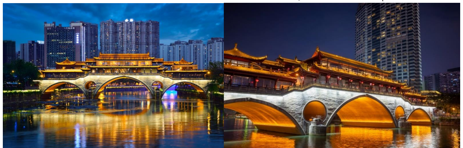
ได้เวลาอันสมควรเดินทางไปยัง ท่าอากาศยานเจิ้งตูเทียนฟู่ ประเทศจีน

นำท่านแวะถ่ายรูปจุดชมวิว สะพานอันซุน เป็นสะพานในเมืองหลวงของเจิ้งตูในมณฑลเสฉวนประเทศจีนเป็นสะพานข้ามแม่น้ำจิน สะพานที่มีหลังคาปิดนั้นมีร้านอาหารที่ค่อนข้างใหญ่และเป็นร้านยอดนิยมที่สุดในเมือง