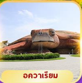
อควาเรียม