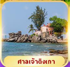
ศาลเจ้าดิงเกา