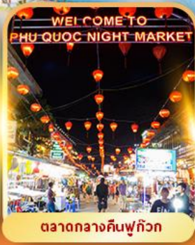
ตลาดกลางคืนฟูก๊วก