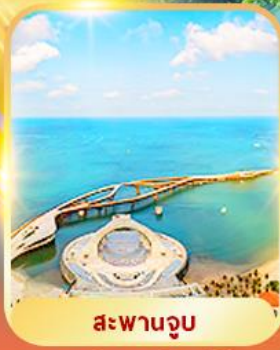
สะพานจูป