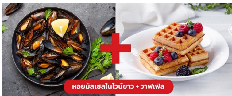
หอยมัสเซลในไวน์ขาว + วาฟเฟิล

เย็น ๑๐ | รับประทานอาหารเย็น (มื้อที่9) เมนูพิเศษ! หอยมัสเซล + วาฟเฟิล (Mussel in White wine + Waffle)