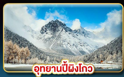
อุทยานปี้ผิงโกว