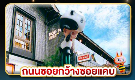
ถนนชอยกวางชอยแคบ