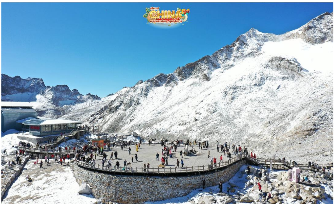
(หมายเหตุ: ปริมาณหิมะขึ้นอยู่กับสภาพอากาศ)

จากนั้น นำท่านเดินทางสู่ เขตอุทยานต้ากู่ปิงชว่น หรือ อุทยานสวรรค์ภูผาหิมะการ์เซียต้ากู่ปิงชว่น (Dagu Glacier National Park) ” โดยเปลี่ยนเป็นรถภายในอุทยาน ชมความงามของ 3 ทะเลสาบสวรรค์ที่