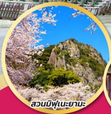
สวนมิฟูเนะยามะ