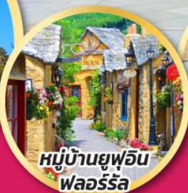
หมู่บ้านยูฟูอิน พลอร์รัล