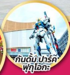
กัณฑ์มึ.ปาร์ค ฟุกุโอกะ