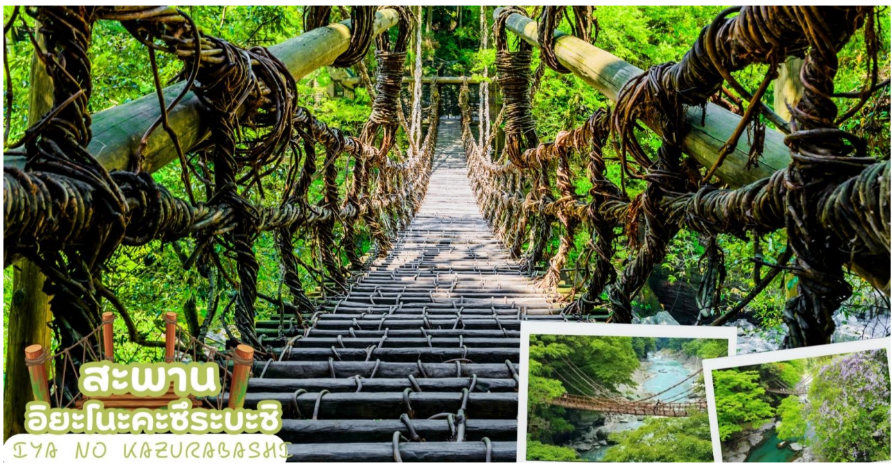
สะพาน อียะโนะคะซึระบะชิ IYA NO KAZURABASHI

นำท่านขอพร ศาลเจ้าโคโตอิระกุ (Kotohira-gu Shrine) หรืออีกชื่อหนึ่งว่า คมปิระซัง (Konpira san) ตั้งอยู่บนภูเขาไซชู จังหวัดคางาวะ (Kagawa) ในเมืองโคโตอิระที่สถิตของเทพเจ้าแห่งทะเลจึงเป็นที่เคารพบูชาของชาวเรือ และเป็น 1 ใน 88 ศาลเจ้าและวัดแห่งการแสวงบุญบนเกาะชิโกะกุ ที่ศาลเจ้าแห่งนี้ยังสามารถสักการะ Juichimen-Kannon หรือเจ้าแม่กวนอิม 11 พักตร์ได้ด้วย การเดินขึ้นไปศาลเจ้าจะต้องขึ้นบันไดกว่า 800 ชั้น และหากต้องการเดินขึ้นไปยังศาลเจ้าชั้นในสุด จะต้องเดินต่ออีก 1,368 ชั้น นอกจากนี้ระหว่างทางเดินก่อนมาถึงศาลเจ้าจะผ่านถนนที่มีร้านค้าตั้งอยู่มากมาย