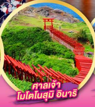
ศาลเจ้า โมโตโนสุมิ อินาริ