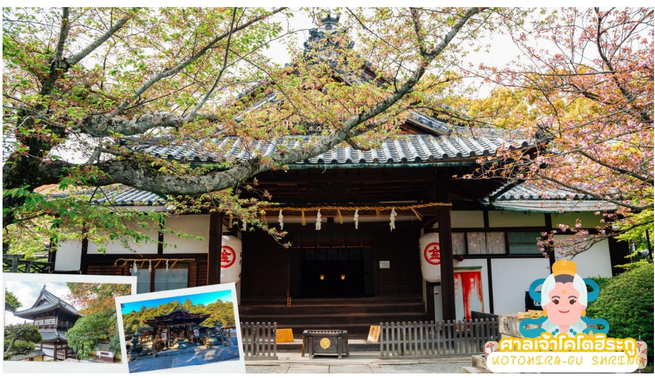
ศาลเจ้าโคโตอิระกุ KOTOHIRA-GU SHRINE

นำท่านขอพร ศาลเจ้าโคโตอิระกุ (Kotohira-gu Shrine) หรืออีกชื่อหนึ่งว่า คมปิระซัง (Konpira san) ตั้งอยู่บนภูเขาไซชู จังหวัดคางาวะ (Kagawa) ในเมืองโคโตอิระที่สถิตของเทพเจ้าแห่งทะเลจึงเป็นที่เคารพบูชาของชาวเรือ และเป็น 1 ใน 88 ศาลเจ้าและวัดแห่งการแสวงบุญบนเกาะชิโกะกุ ที่ศาลเจ้าแห่งนี้ยังสามารถสักการะ Juichimen-Kannon หรือเจ้าแม่กวนอิม 11 พักตร์ได้ด้วย การเดินขึ้นไปศาลเจ้าจะต้องขึ้นบันไดกว่า 800 ชั้น และหากต้องการเดินขึ้นไปยังศาลเจ้าชั้นในสุด จะต้องเดินต่ออีก 1,368 ชั้น นอกจากนี้ระหว่างทางเดินก่อนมาถึงศาลเจ้าจะผ่านถนนที่มีร้านค้าตั้งอยู่มากมาย