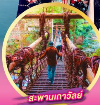
สะพานเกาวัลย์