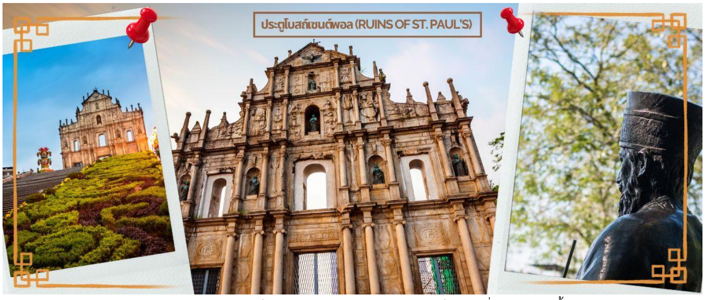
ประตูโบสถ์เซนต์พอล (RUINS OF ST. PAUL'S)

CTGHKG1 ฮ่องกง-มาเก๊า ซีฮ่องรวย ไหว้ 3 เจ้าแม่กวนอิม 3วัน 2คืน THAI AIRWAYS (TG) (MAR-DEC 25)