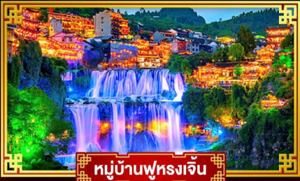
หมู่บ้านฟุรงเจิ้น