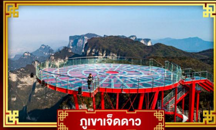
กุเขาเจ็ดดาว

“ฟุรงเจิ้น” อสังการหมู่บ้านโบราณริมน้ำตก