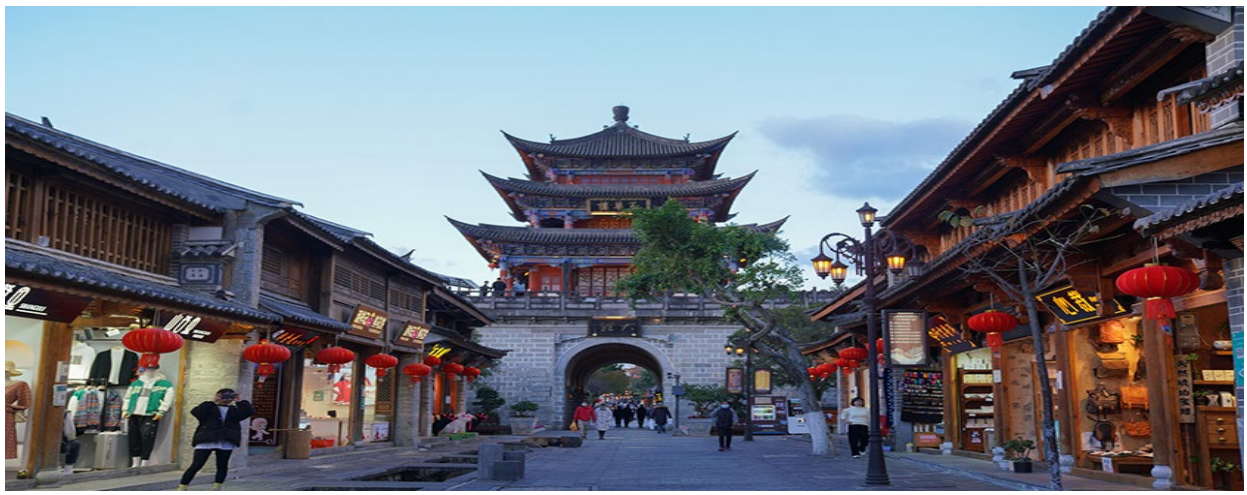
ที่พัก LANDSCAPE HOTEL ระดับ 4 ดาวหรือเทียบเท่า

อิสระเดินเที่ยวชม เมืองโบราณต้าหลี่ หรือ ต้าหลี่กุ่เจิง ในยามค่ำคืน โดยเฉพาะ ถนนชาวต่างชาติ ต้าหลี่ หรือ ถนนหูกั่ว ในเมืองโบราณ ที่คึกคักมีชีวิตชีวา ด้วยร้านค้า, ร้านอาหาร,ร้านชา, ร้านขาย เครื่องประดับ, ร้านขายของโบราณ, ร้านผ้ามัดย้อม ที่ดึงดูดนักท่องเที่ยวให้เข้ามาเที่ยวชมและพักผ่อน