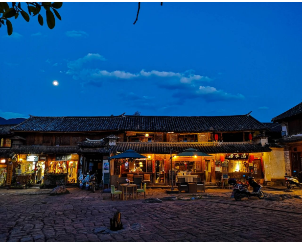
KMG04(DR)Lijiang Winter Cherry Blossom ๖.ค.2567