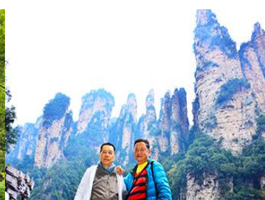
ชมจุดชมวิวลีฟก้าแก้ว