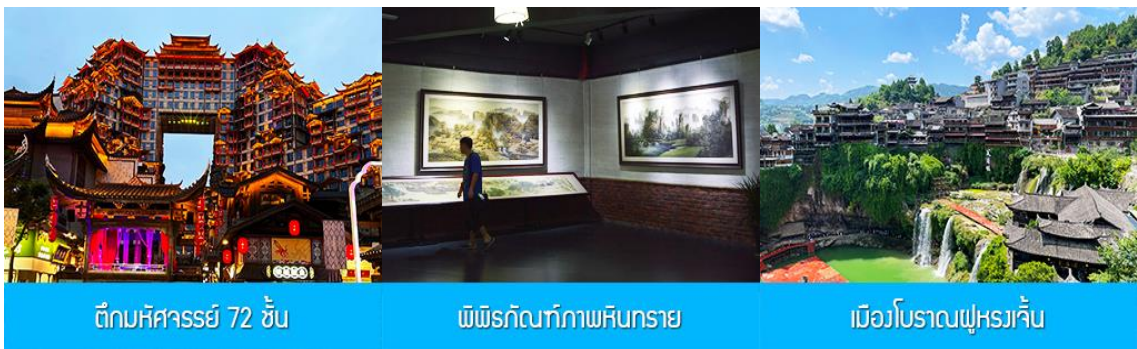
ตึกหิคารร์ยี่ 72 ชั้น

พักที่ CHANGDE YUNXI HOTEL ระดับ 4 ดาวท้องถิ่น หรือเทียบเท่าในเมืองฉางเต๋อ