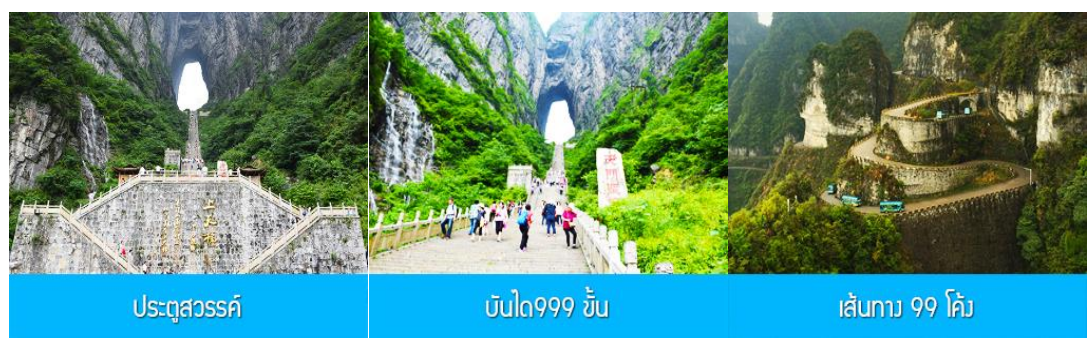
ประตูลูกศร บันได 999 ขั้น เส้นทาง 99 โค้ง