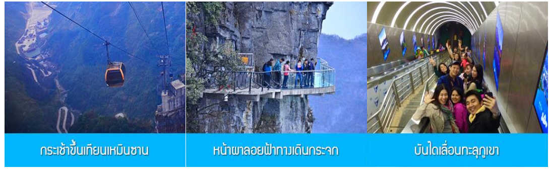
กระเช้าขึ้นเทียนเหมินซาน หน้าผาลอยฟ้าทางเดินกระจก บันไดเลื่อนทะลุภูเขา

https://hk.trip.com/hotels/guzhang-hotel-detail-68614854/chaxitai-holiday-hotel/