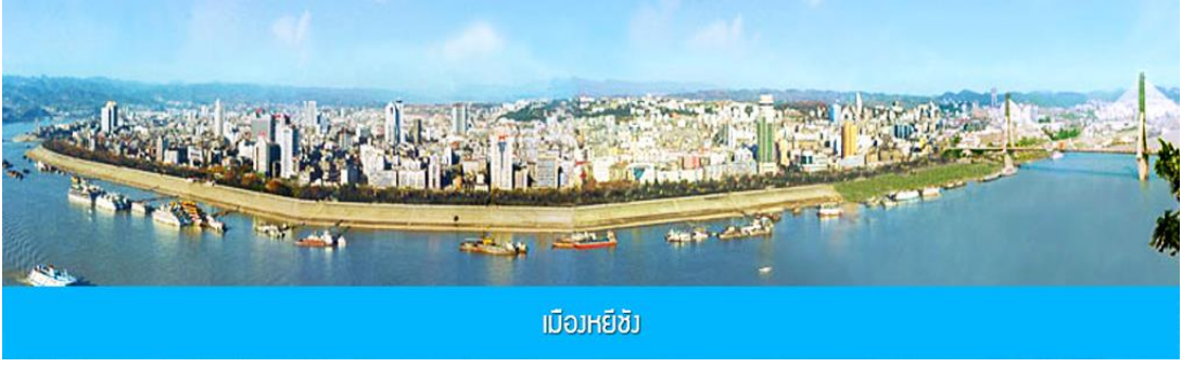
เมืองหยีฉาง