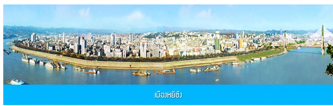
เมืองหยี่ชัง