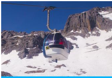
ภูเขาหิมะมังกรหยก (บึงกระชาใหญ่)

ที่พัก FENG HUANG HOTEL ระดับ 4 ดาว หรือเทียบเท่าเมืองลี่เจียง