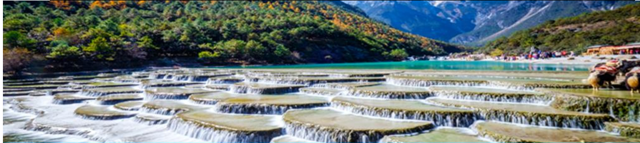
หุบเขาพระจันทร์สีน้ำเงิน Blue Moon Valley

หมายเหตุ กรณีที่กระเช้าใหญ่ขึ้นภูเขาหิมะมังกรหยกปิดให้บริการ ด้วยเหตุที่สภาพอากาศไม่เอื้ออำนวย หรือเป็นการปิดเพื่อตรวจสอบสภาพและซ่อมแซมประจำปี ทางทัวร์ขอสงวนสิทธิ์ที่จะจัดโปรแกรมขึ้นกระเช้า ที่จุดชมวิวภูเขาหิมะมังกรหยก ณ สถานีกระเช้าหยุนซานผิง แทน