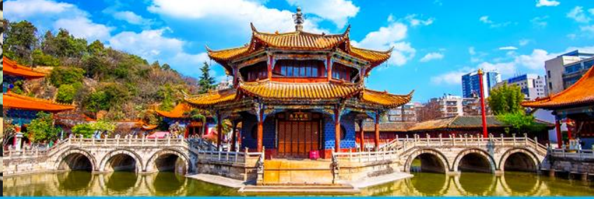
วัดหวนกง