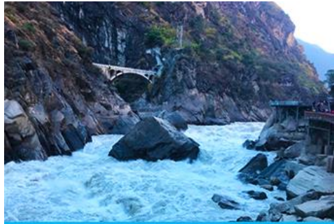
ช่องแคบเลือกระโจน

พักที่ DALI ZHUANGYUAN HOTEL ระดับ 4 ดาวหรือเทียบเท่าในเมืองต้าหลี่