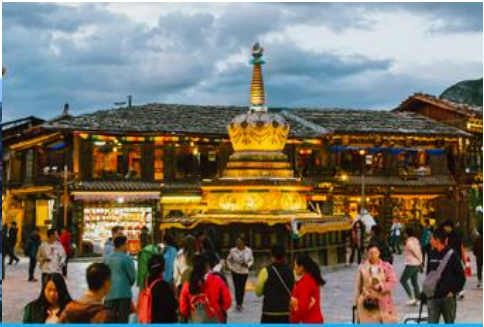
เมืองโบราณแชงกรีล่า