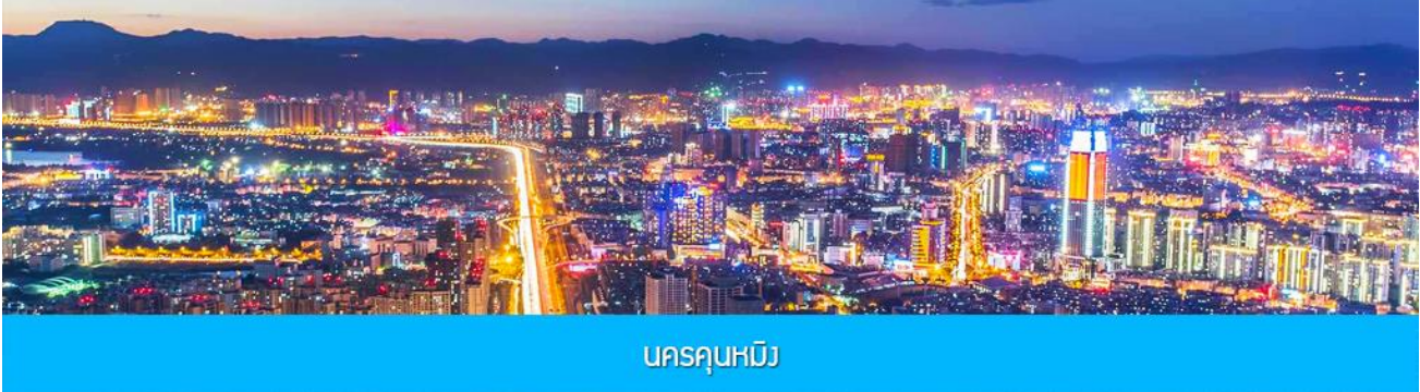
นครคุนหมิง