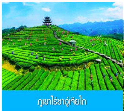
ภูเขาไร่ชาอุ๋เจียโก

พักที่ โรงแรม ENSHI XIPU HOTEL ระดับ 4 ดาวท้องถิ่นหรือเทียบเท่าในเมืองเินซือ