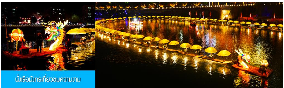
นั่งเรือมังกรเที่ยวชมความงาม

หลังอาหารนำท่านเดินทางเข้าที่พัก หรือท่านสามารถเลือกซื้อ โปรแกรมเสริม เป็นตัวนั่งเรือมังกรเที่ยวชมความงามของ บ้านเรือนและสิ่งปลูกสร้างสองฝั่งแม่น้ำในช่วงที่สวยงามที่สุดของเมือง เซียนอิน ที่ประดับประดาด้วยแสงสี และได้ชื่อว่า เป็นวิวยามค่ำคืนที่สวยงามที่สุดในมณฑลหูเป่ย์ เช่นเดียวกับเมืองโบราณฟงหวงในมณฑลหูหนาน....อัตราค่าบริการสำหรับ โปรแกรมเสริมนั่งเรือมังกรชมวิวยามค่ำคืน ท่านละ 190 หยวน หรือ 950 บาท ระยะเวลาที่ใช้ในการเรือมังกร ประมาณ 45 นาที ค่าบริการรวม ค่าบัตรเข้าชม ค่ารถรับ ส่ง และค่าน้ำดื่มของโถงท้องถิ่น