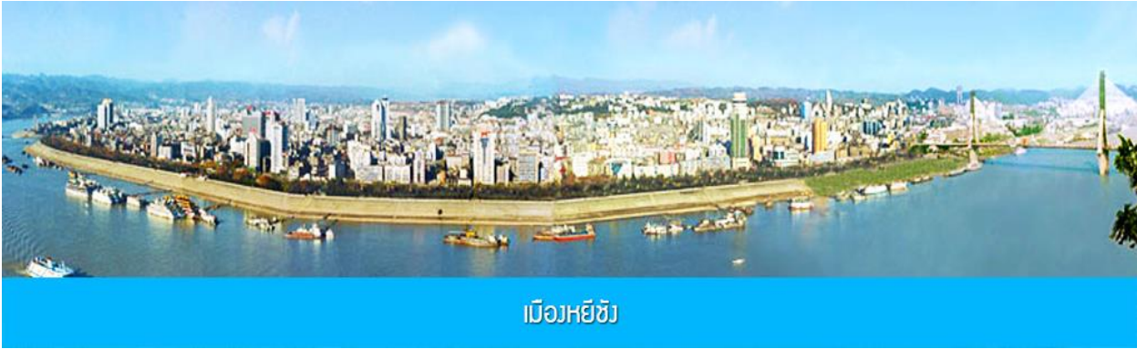
เมืองหยี้ชัง