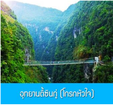
อุทยานตี้ซินกู่ (โกรกหัวใจ)

พักที่ โรงแรม ENSHI XIPU HOTEL ระดับ 4 ดาวท้องถิ่นหรือเทียบเท่าในเมืองเียนซือ