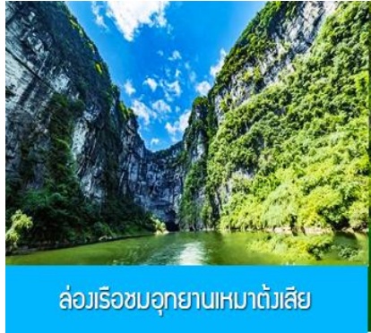
ล่องเรือชมอุทยานเหมาต้งเสี่ย