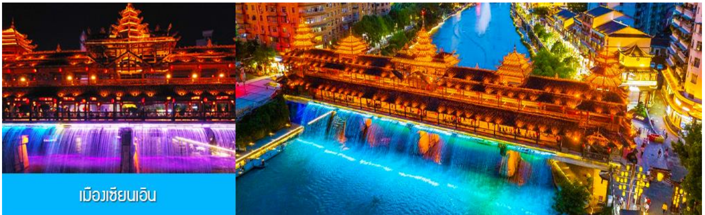
เมืองเซียนเอิน