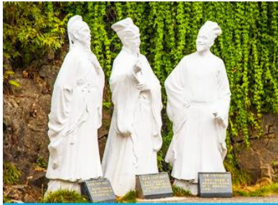
อุทยานถ้ำสามสหาย