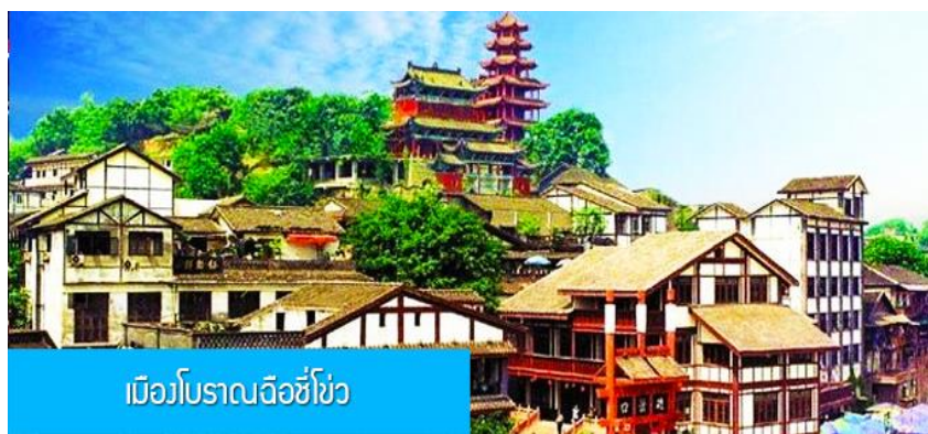
เมืองโบราณฉือชี่โข่ว

ออฟชั่น ไกด์ขายล่องเรือแม่น้ำฉงชิ่ง ชมความสวยงามของสองริมฝั่งแม่น้ำเมืองฉงชิ่ง ล่องเรือ ท่านละ 280 หยวน หรือประมาณ 1,400 บาท พักที่ HOLIDAY INN EXPRESS HOTEL โรงแรมระดับ 4 ดาวหรือเทียบเท่าในเมืองฉงชิ่ง