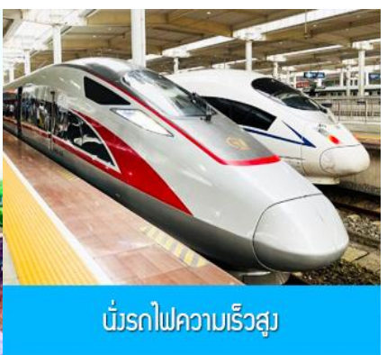
นั่งรถไฟความเร็วสูง