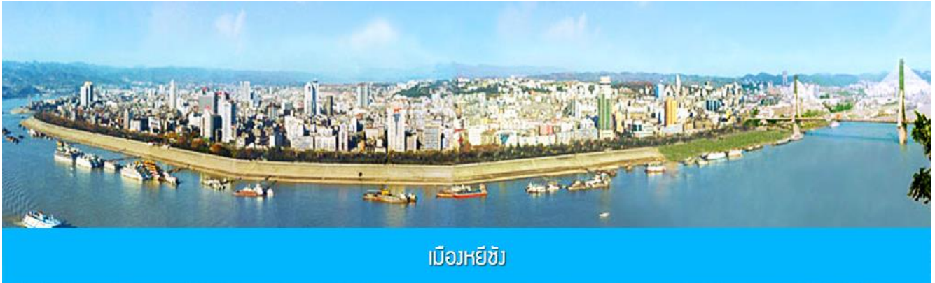
เมืองหยีซัง