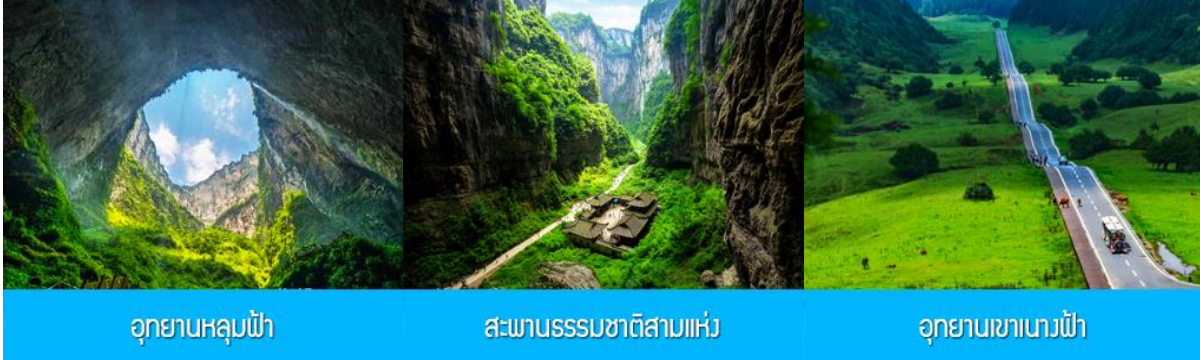
อุทยานหลุมฟ้า

พักที่ HOLIDAY INN EXPRESS HOTEL โรงแรมระดับ 4 ดาวหรือเทียบเท่าในเมืองฉิ่ง