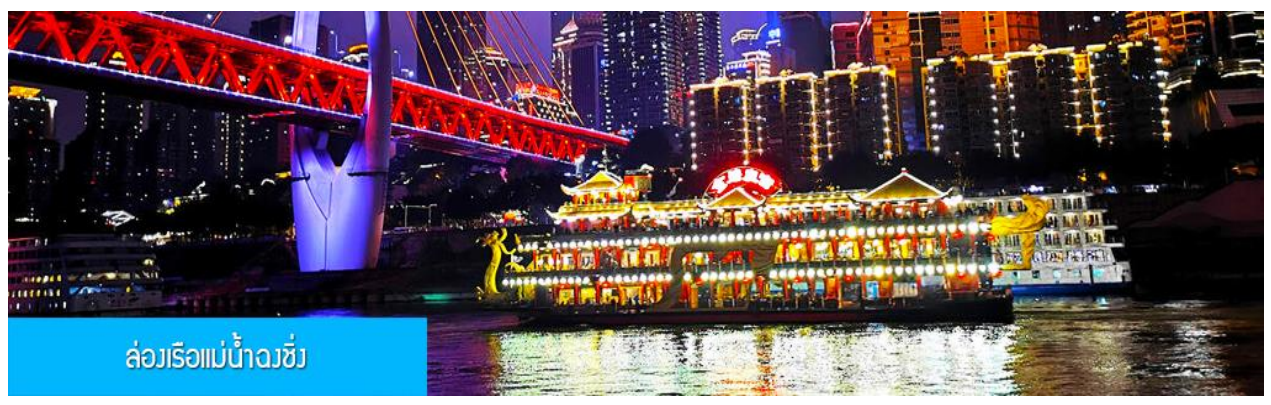
ล่องเรือแม่น้ำฉงชิ่ง

ออฟชั่น ไกด์ขายล่องเรือแม่น้ำฉงชิ่ง ชมความสวยงามของสองริมฝั่งแม่น้ำเมืองฉงชิ่ง ล่องเรือ ท่านละ 280 หยวน หรือประมาณ 1,400 บาท พักที่ HOLIDAY INN EXPRESS HOTEL โรงแรมระดับ 4 ดาวหรือเทียบเท่าในเมืองฉงชิ่ง