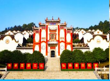
บ้านเกิดกวี ชวีหยวน