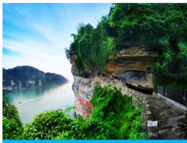
สวนถ้ำสามสหาย