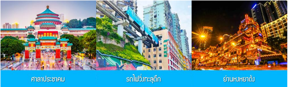
ศาลาประชาชน

พักที่ MOUNTAIN VIEW HOTEL โรงแรมระดับ 4 ดาวหรือเทียบเท่าในเมืองอู่หลง