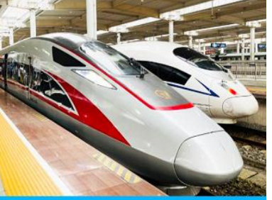
บั้งรถไฟความเร็วสูง