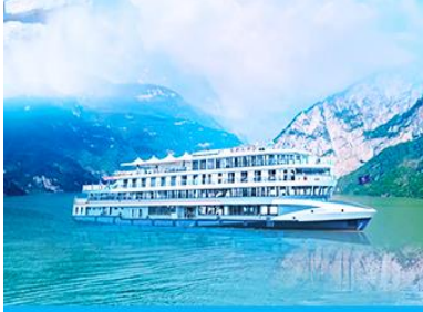
ล่องเรือชมเขื่อนสามผา