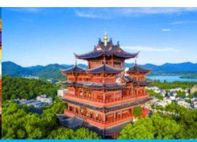
หอฉิงหวงก่อ