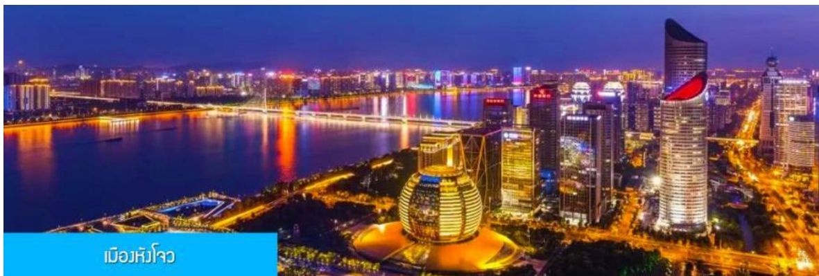
เมืองหังโจว