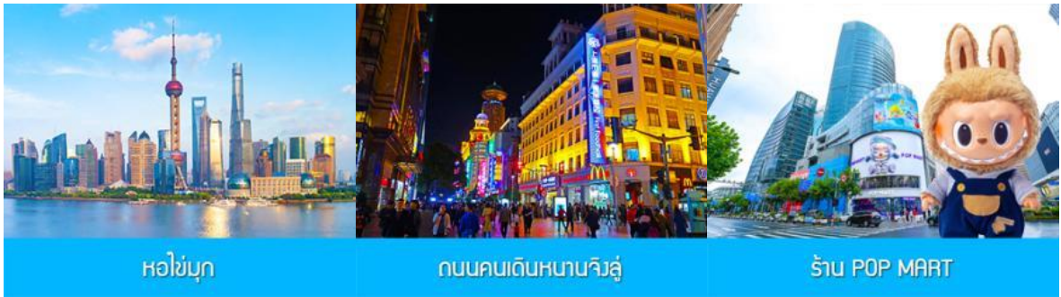
หอไข่มุก