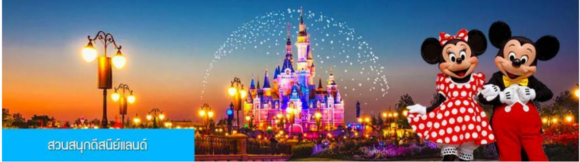
สวนสนุกดิสนีย์แลนด์

วันที่สาม วันอิสระให้ท่านอิสระพักผ่อนหรือเดินเที่ยวตามอัชฌาศัย ไกด์ท้องถิ่นเสนอขายออฟชั่น