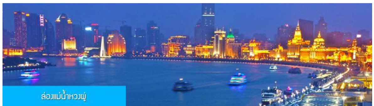
ล่องแม่น้ำหวงผู่

OPTIONAL TOUR 2 ไกด์ท้องถิ่นเสนอขายออฟชั่น ล่องแม่น้ำหวงผู่ ชมแสงสียามค่ำคืน และอุโมงค์เลเซอร์ลอดแม่น้ำ รวมอาหารค่ำ สุกี่หม่าล่า ในราคา ท่านละ 480 หยวน (หากจำนวนไม่ถึง 8 ท่าน ไกด์ไม่สามารถจัดได้)