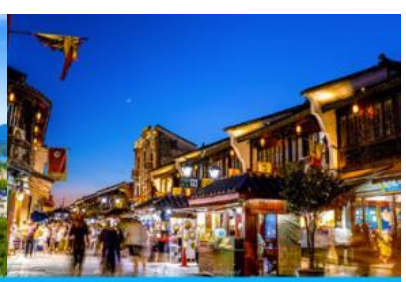
ย่านหอฟางเจีย