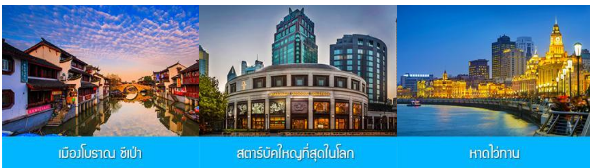
เมืองโบราณ ซิเป่า