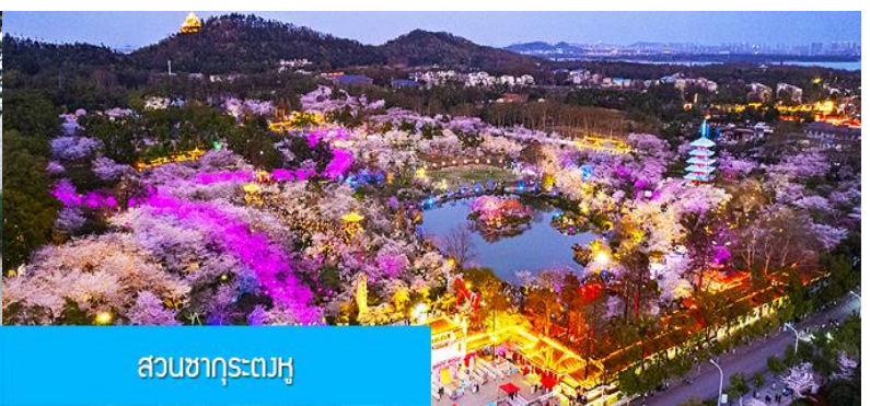
สวนซากุระตงหู