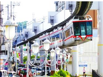
นิมรคไฟฟ้าขบวนลาวเดี่ยว