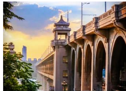
สะพานข้ามแม่น้ำหวู่ฮั่น

ไกด์ท้องถิ่นเสนอขาย โปรแกรมล่องเรือแม่น้ำแยงซีเกียง ชมความสวยงามของตึกที่ประดับประดาด้วยแสงสีในยามค่ำคืนของสองริมฝั่งแม่น้ำเมืองหวู่ฮั่น ค่าแพ็คเกจล่องเรือ ท่านละ 300 หยวน หรือประมาณ 1,500 บาท พักที่ WUHAN YUETING HOTEL โรงแรมระดับ 4 ดาวที่อิงถิ่นหรือเทียบเท่าในเมืองหวู่ฮั่น