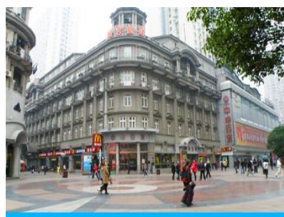
ถนนคนเดินเจียงอันลู่