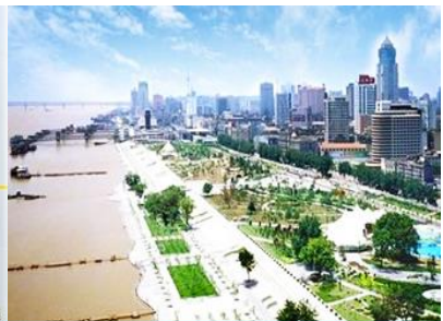
หาดฮั่นฮั่วเจียงกาน