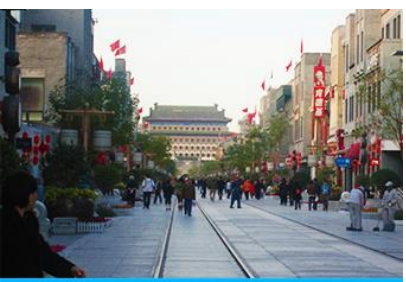
ถนนเจียนเหมิน