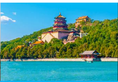
พระราชวังฤดูร้อนหยีเหอหยวน