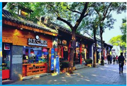
ซอยหนานหลิวกู่เซี่ย