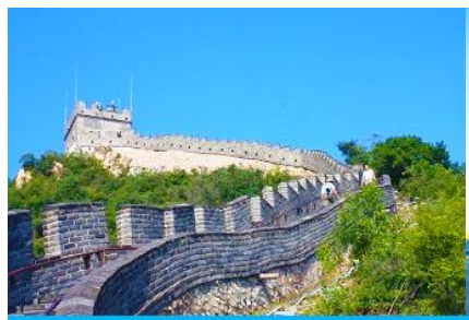
กำแพงเมืองจีนด่านจวิยกวน

พักที่ JINGLIN HTL OR HOLIDAY INN EXPRESS HTL 4* หรือโรงแรมในระดับเดียวกันในกรุงปักกิ่ง