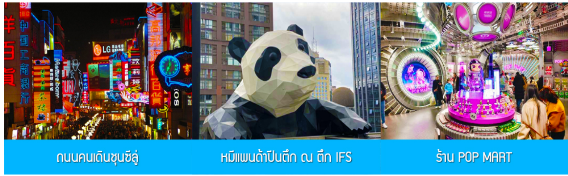
ถนนคนเดินชุนชิว

ค่ำ รับประทานอาหารค่ำ ณ ภัตตาคาร พักที่ SEREMGETI หรือ โรงแรมระดับเดียวกัน โรงแรมระดับ 4 ดาวท้องถิ่นหรือเทียบเท่า