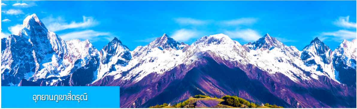
อุทยานภูเขาสิ่วครุณี