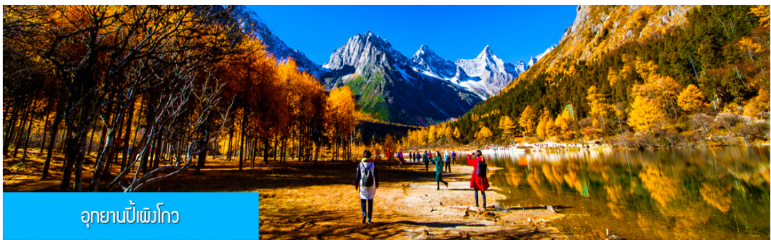
อุทยานปีเพ็งโกว