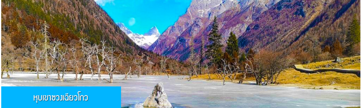
หุบเขาชวงเจียวโกว

นำท่านเที่ยวชม หุบเขาชวงเจียวโกว 双桥沟景区 ที่เป็นแหล่งท่องเที่ยวที่สวยงามที่สุดแห่งหนึ่งในเขตอุทยานสิ่วครุณี นำท่านนั่งรถบัสของอุทยานที่วิ่งไปผ่านเส้นทางที่สร้างคู่ขนานกับลำธารภายในหุบเขา ท่านจะได้สัมผัสกับความสวยงามของทัศนียภาพธรรมชาติที่หาชมได้ยาก โดยมีภูเขาหิมะสูงตระหง่านอยู่เบื้องหลัง ธารน้ำใสไหลริน และสระน้ำที่มีสีเขียวมรกต ในฤดูใบไม้ผลิและฤดูร้อนท่านจะได้เห็นฝูงจามรีท่ามกลางทุ่งหญ้าเขียวจี ส่วนในฤดูหนาวทุ่งหญ้าและพื้นดินจะปกคลุมด้วยพรมหิมะสีขาว.. รถบัสของอุทยาน จะนำนักท่องเที่ยวไปยังจุดชมวิวสำคัญต่าง ๆ ภายในเขตอุทยาน เพื่อให้นักท่องเที่ยวได้เที่ยวชมสถานที่และถ่ายรูปตามอัธยาศัย จนครบแก่เวลา นำคณะขึ้นรถเมล์ออกจากอุทยาน (จุดเที่ยวชมความสูงเหนือระดับน้ำทะเล 3,800 เมตร)