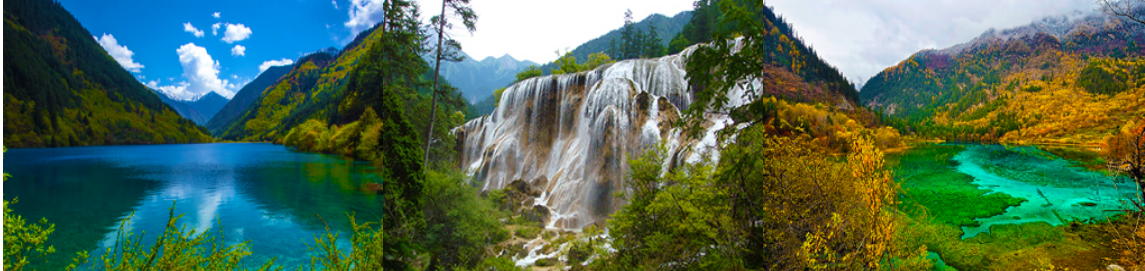
ทะเลสาบไธเส (RHINO LAKE) น้ำตกธารไข่มุก ทะเลสาบนกยูง (PEACOCK LAKE)

ฤดูกาลผลิ ด้วยความสวยงามจึงทำให้อุทยานแห่งชาติจ้าว้ายโกว ได้ถูกขึ้นทะเบียนเป็นมรดกโลกทางธรรมชาติ ในปีค.ศ. 1992