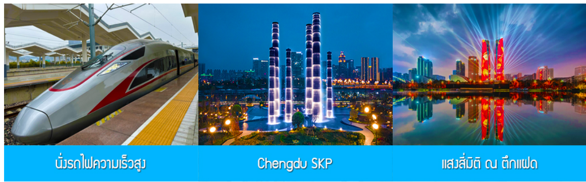
บั้งรถไฟความเร็วสูง