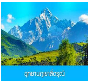
อุทยานภูเขาสี่ครุณี

ค่ำ รับประทานอาหารค่ำ ณ ภัตตาคาร พักที่ SI GUNIANG SHAN HOTEL 4* หรือระดับ4ดาวพื้นเมือง