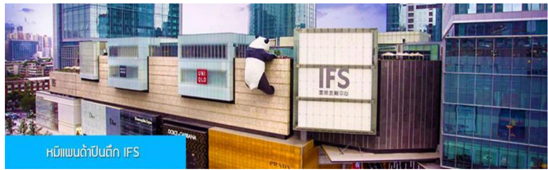
หมีแพนด้าปีนตึก IFS

ชม หมีแพนด้าปีนตึก ณ ตึก IFS 熊猫爬楼 จุดเช็คอินใหม่สำหรับชาวเมืองเฉิงตูและนักท่องเที่ยวผู้มาเยือน ท่านจะได้ตะลึงกับตูกตาแพนด้ายักษ์ที่มีความสูง 15 เมตร น้ำหนัก 13 ตัน ปีนเกาะอยู่บนยอดตึก IFS ใจกลางเมืองเฉิงตู.