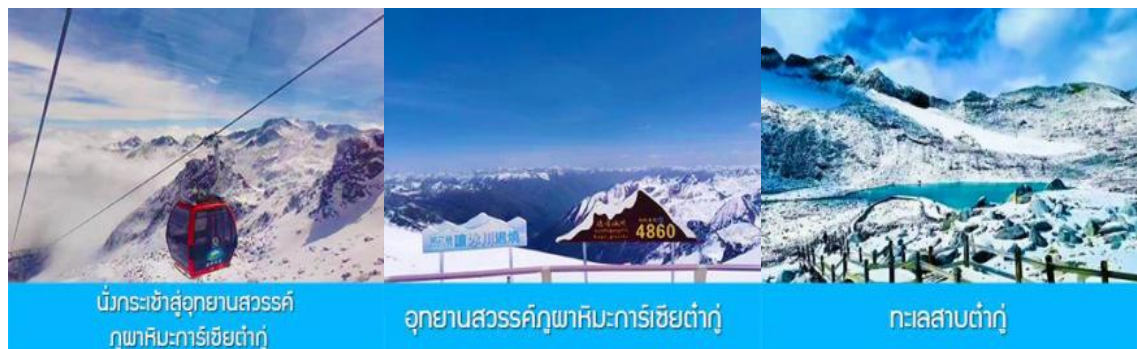
นั่งกระเช้าสู่อุทยานสวรรค์ ภูเขาคิมมาร์ทเซียต้ากู่