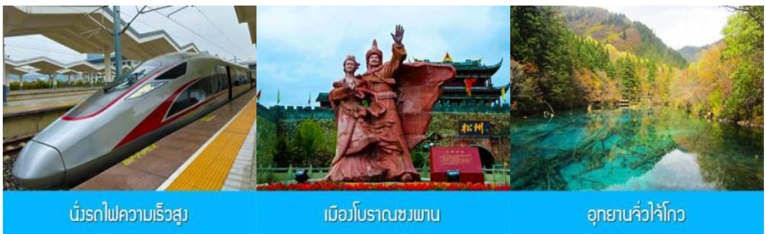
บริการไฟความเร็วสูง