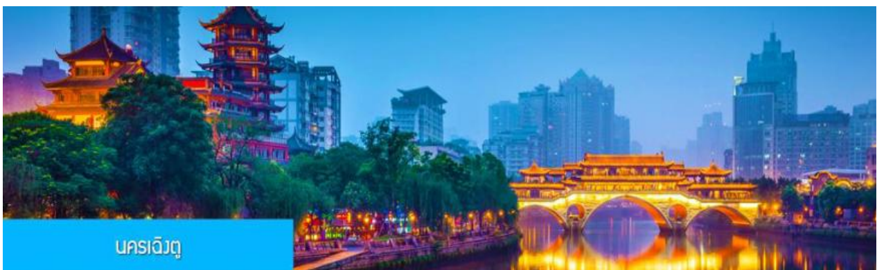
นครฉางกุ