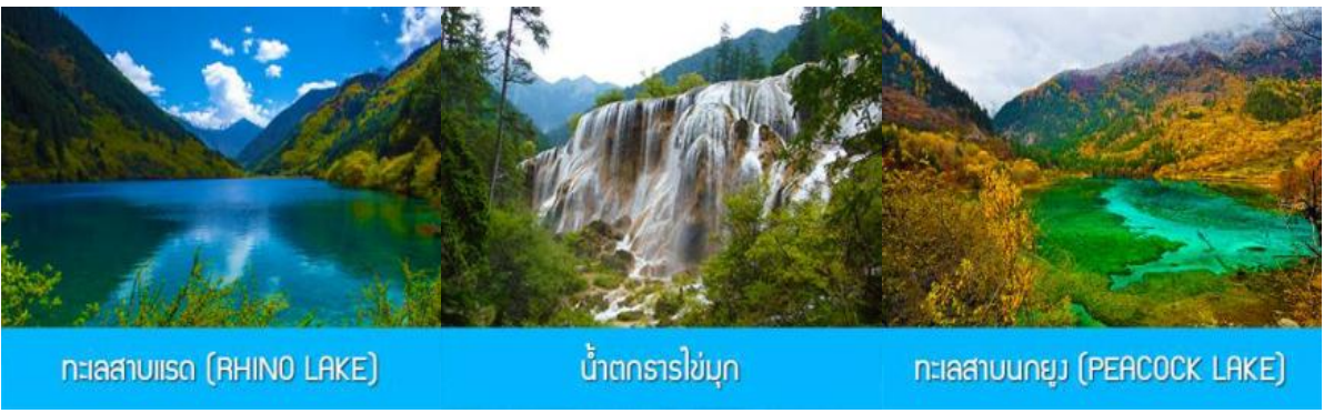
ทะเลสาบไธด (RHINO LAKE)

หลังอาหารเช้าท่านเดินทางสู่ อุทยานแห่งชาติจิวจ้ายโกว 九寨沟景区 ตั้งอยู่ด้านทิศเหนือของมณฑลเสฉวน ซึ่งเป็นส่วนหนึ่งในบริเวณตอนใต้ของเทือกเขาหิมงซาน ห่างออกไปจากตัวเมืองเฉิงตูราว 500 กิโลเมตร จิวจ้ายโกวมีชื่อเสียงด้านความงามแห่งสีสันที่แปลกเปลี่ยนไม่รู้จบ ทะเลสาบผุดขึ้นท่ามกลางหมอกเมฆไม้เขียวขจี น้ำใสเป็นประกายชุ่มฉ่ำ ขอดเขาหิมะตัดกับท้องฟ้าสีคราม เกิดเป็นภาพธรรมชาติอันงดงามที่แปรเปลี่ยนไปตามฤดูกาลผลิ ด้วยความสวยงามจึงทำให้อุทยานแห่งชาติจิวจ้ายโกว ได้ถูกขึ้นทะเบียนเป็นมรดกโลกทางธรรมชาติในปีค.ศ. 1992