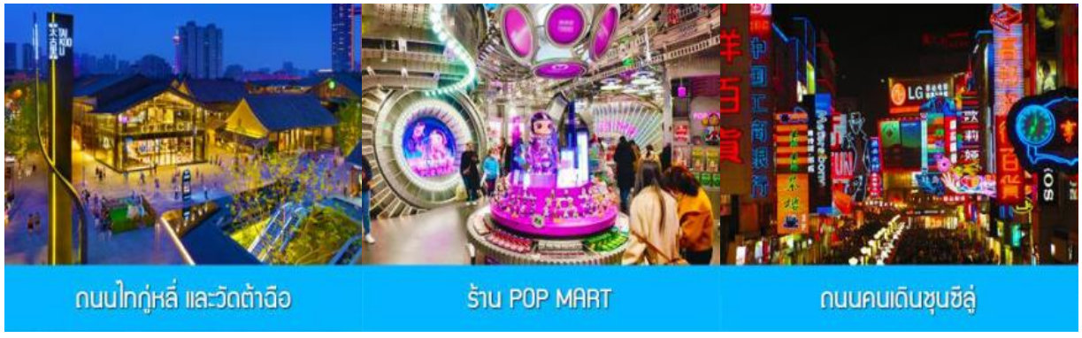
ถนนไท่กุ่หลี่ และวัดต้าฉือ

พักที่ โรงแรม SERENGETI HOTEL ระดับ4 ดาวห้องถื่นหรือเทียบเท่า