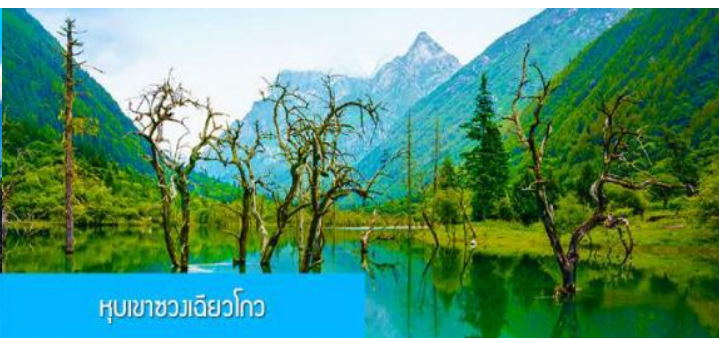
หุบเขาชวงเจียวโกว