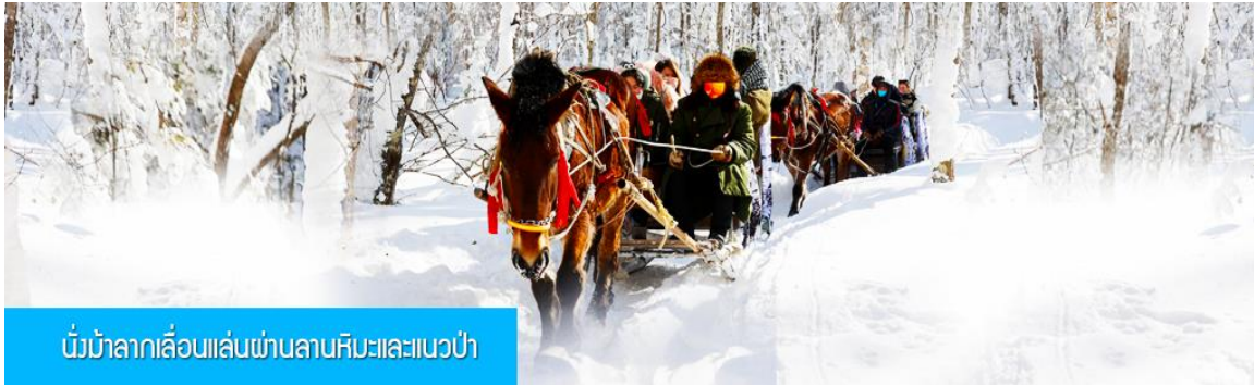
นั่งม้าลากเลื่อนผ่านลานหิมะและแนวป่า

รายการที่ 2 นั่งม้าลากเลื่อนผ่านลานหิมะและแนวป่า 马拉雪橇 ท่ามกลางสิ่งแวดล้อมของหิมะราวกับอยู่ในโลกแห่งเทพนิยาย ผ่านหมู่บ้าน เว่ยหู่จ้าย 威虎寨 ที่อดีตเคยเป็นที่ตั้งของรังโจรที่มักออกปล้นสะดมชาวบ้าน ม้าลากเลื่อนเป็นยานพาหนะเฉพาะพื้นที่ ๆ ได้รับความนิยมมากในอดีต การเดินทางในช่วงฤดูหนาวต้องใช้ม้าลากจูงลากเลื่อนให้สามารถวิ่งเล่นบนลานหิมะได้ โดยลากเลื่อนที่มีม้าเป็นตัวลากจูงสามารถลัดเลียงได้ทั้งผู้คน และข้าวของเสียบ้างต่าง ๆ ...เวลาที่ใช้สำหรับ โปรแกรมเสริมนี้ประมาณ 40 นาที อัตราค่าบริการ ท่านละ 240 หยวน หรือ 1200 บาท อัตรานี้รวมค่าบริการผ่านเข้าอุทยาน ค่ารถรับ ส่ง และค่าบริการของไกด์ท้องถิ่น และค่าบริการจัดการของบริษัททัวร์ท้องถิ่น... หมายเหตุ โปรแกรมเสริมเป็นโปรแกรมที่ท่านต้องเสียค่าใช้จ่ายเองด้วยความสมัครใจ สำหรับท่านที่ไม่เข้าร่วมกิจกรรมดังกล่าวสามารถนั่งพักในรถได้