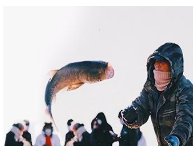
การจับปลาในฤดูหนาว

นำท่านชม การจับปลาในฤดูหนาว 冬捕 เป็นวิธีการจับปลาตามแม่น้ำและแหล่งน้ำในฤดูหนาวที่สืบทอดกันมาช้านาน โดยชาวบ้านจะนำแหดักปลามาวางดักไว้ตามจุดต่าง ๆ ก่อนที่ผิวน้ำจะปกคลุมด้วยน้ำแข็ง หลังจากผิวน้ำกลายเป็นน้ำแข็งแล้ว ชาวบ้านจะเจาะพื้นน้ำแข็งบริเวณที่มาแหวางดักอยู่เพื่อยกแหขึ้น จะมีปลาติดแหเป็นจำนวนมาก...พิเศษ ให้ท่านได้ชมการยกแหดักปลาจากสถานที่จริง และให้ท่านได้ชิมซูชิเนื้อปลาสด ๆ ที่ได้จากแหดักปลา