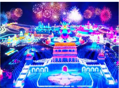
เทศกาลแกะสลักน้ำแข็งนานาชาติ