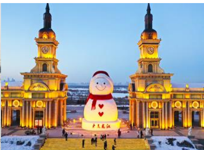
ตุ๊กตาทิมะยักซ์