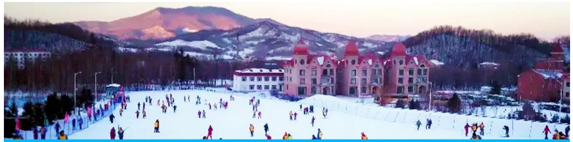
ลานสกียาบูลิ

พักที่ HARBIN REZEN HOTEL โรงแรมระดับ 4 ดาวท้องถิ่นหรือเทียบเท่า ในเมืองฮาร์บิน