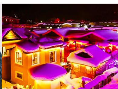
เมืองหิมะ Xue xiang