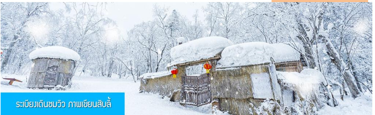
ระเบียบเดินชมวิว ภาพเขียนสไลด์

เที่ยง รับประทานอาหารกลางวัน ณ ภัตตาคาร หลังอาหารนำท่านเดินทางกลับเมืองฮาร์บิน (ใช้เวลาเดินทางโดยรถบัสราว 5 ชั่วโมง) ระหว่างทางไกด์ท้องถิ่นจะเสนอขายโปรแกรมเสริมที่ไม่ได้รวมในค่าทัวร์ (ออฟชั่นแนล ทัวร์) 2 รายการ