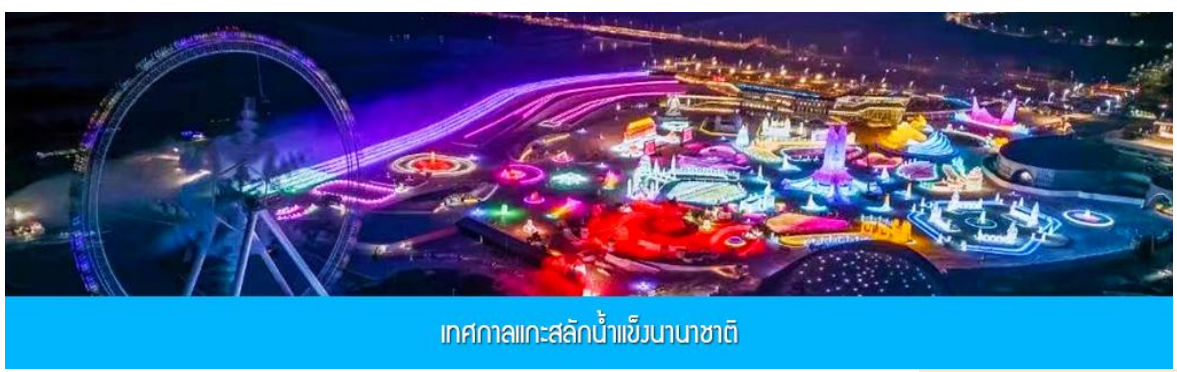
เทศกาลแกะสลักน้ำแข็งนานาชาติ

หลังอาหารนำท่านเที่ยวชมงาน เทศกาลแกะสลักน้ำแข็งนานาชาติ 冰雪大世界 Harbin 2025 International Ice and Snow Festival งานนิทรรศการและศิลปกรรมแกะสลักนานาชาติประจำปีที่ยิ่งใหญ่และอลังการ ด้วยสภาพอากาศที่หนาวเย็นในช่วงฤดูหนาวของเมืองฮาร์บิน ที่นี่ได้กลายเป็นลานประกวดประติมากรรมน้ำแข็งกลางแจ้งที่ใหญ่และมีชื่อเสียงที่สุดของโลก ให้ท่านได้เดินเที่ยวชมความสวยงาม ตระการตาของประติมากรรมน้ำแข็งที่ประดับด้วยแสงสีตามอัธยาศัย.....จนสมควรแก่เวลา นำท่านเดินทางกลับโรงแรม (งานเทศกาลคาดการณ์เปิดวันที่ 15 ธันวาคม 2024 และ จะปิดวันที่ 28 กุมภาพันธ์ 2025)