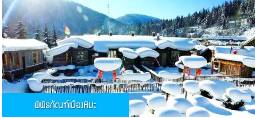
พิพิธภัณฑ์เมืองหิมะ