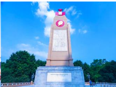
อนุสาวรีย์ฟงหวง