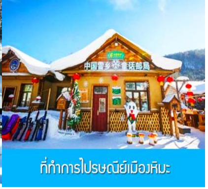
ที่ทำการไปรษณีย์เมืองหิมะ