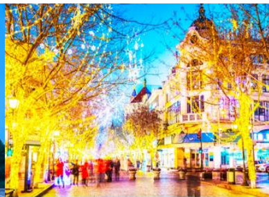
ถนนววยี่ลู่

วันที่ห้า เมืองฮาร์บิน – โบสถ์โซเฟีย – อนุสาวรีย์ป้องกันอุทกภัย – ถนนจงยั้งลู่ – นั่งรถไฟความเร็วสูงกลับเมืองต้าเหลียน – จัตุรัสชิงไห่ – ถนนรัสเซีย