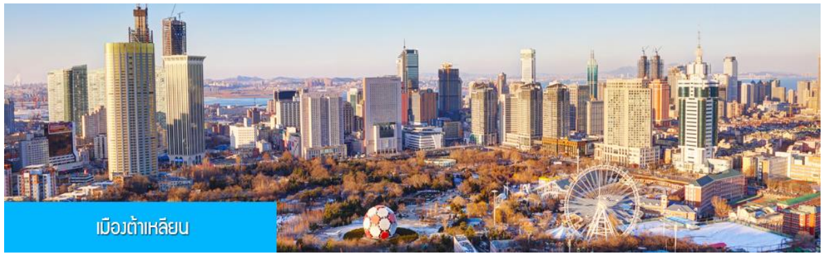
เมืองต้าเหลียน