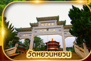
วัดหยวนหยวน