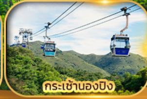
กระเช้านองปิง