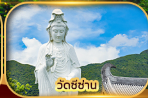
วัดชีซาน