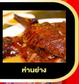
LEI YUE MUN