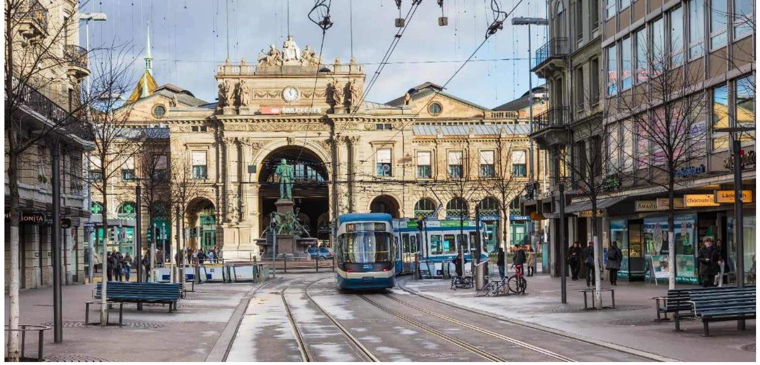
อิสระเดินเล่น ถนนบานโฮฟชตราเซอร์ (Bahnhofstrasse) ถนนการค้าเก่าแก่ที่รุ่งเรือง ตลอดสองข้างทางของถนน เรียงรายด้วยร้านค้าแบรนด์เนมระดับโลกมากมาย จนได้ชื่อว่า “ถนนช้อปปิ้งที่แพงที่สุดในโลก”