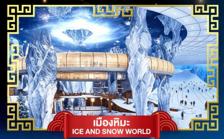
เมืองหิมะ ICE AND SNOW WORLD