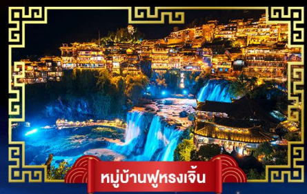
หมู่บ้านฟูรงเจิน