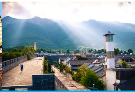
หมู่บ้านฮัวโจว(หมู่บ้านชาป๋อ)