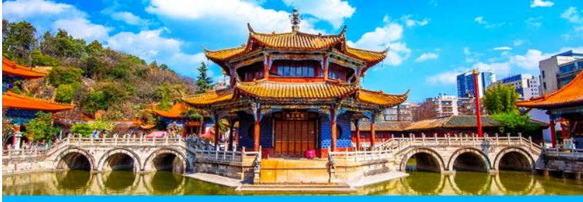
วัดหยวงง