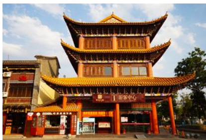
เมืองโบราณกวนตุ๋

พักที่ FEI LONG HOTEL ระดับ 4 ดาว หรือเทียบเท่าในเมืองต้าหลี่