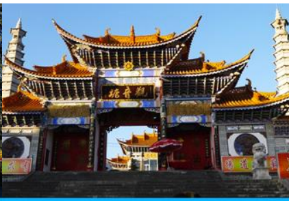
วัดเจ้าแม่กวนอิมเปลวกาย