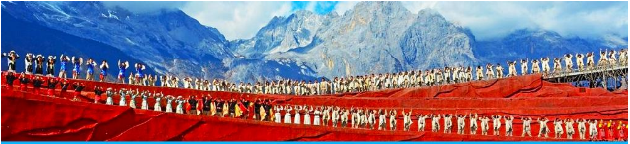
การแสดง IMPRESSION LIJIANG

หลังอาหารนำท่านชมการแสดง IMPRESSION LIJIANG โชว์อันยิ่งใหญ่โดยผู้กำกับชื่อก้องโลก “จาง อวิ๋หมว” ได้เนรมิต ให้ภูเขาหิมะมังกรหยกเป็นฉากหลัง และบริเวณทุ่งหญ้าเป็นเวทีการแสดง โดยใช้นักแสดงกว่า 600 ชีวิต แสง สี เสียง การแต่งกายตระการตา เล่าเรื่องราวชีวิตความเป็นอยู่ และชาวเผ่าต่างๆ ของเมืองลี่เจียง