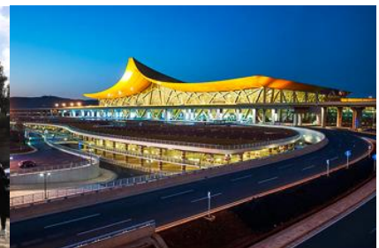
สนามบินเมืองคุนหมิง