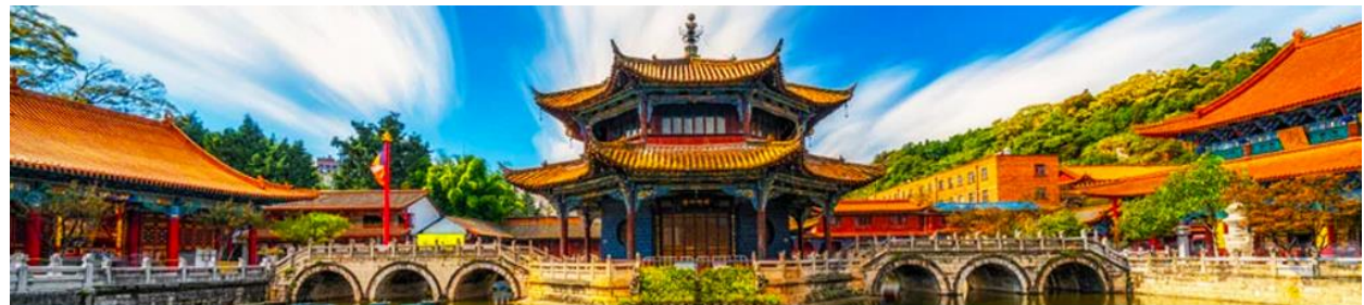
วัดหยวนกง

พักที่ VIENNA HOTEL ระดับ 4 ดาว หรือเทียบเท่าในเมืองคุนหมิง