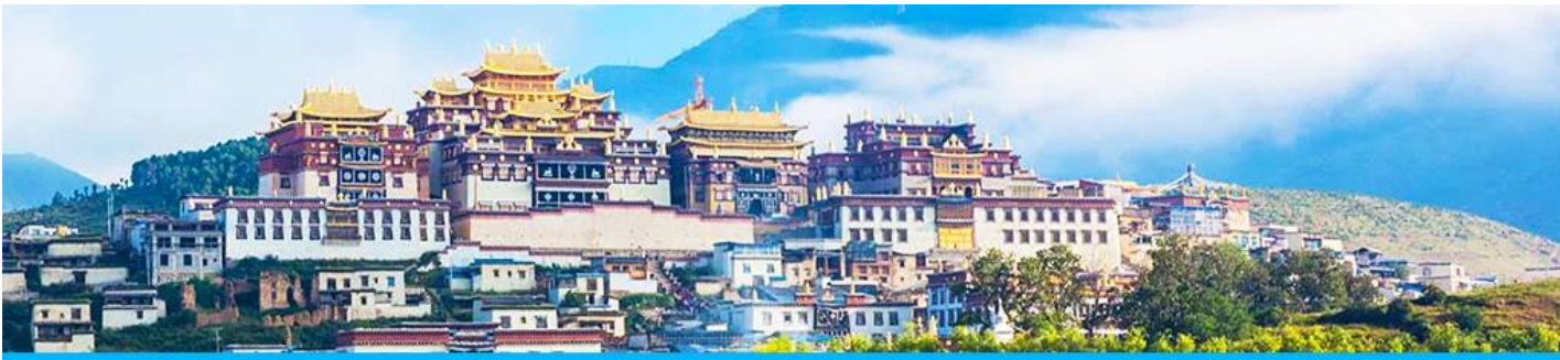
เมืองโบราณแซงกริล่า

จากนั้นนำท่านชม หมู่บ้านซีโจวหรือหมู่บ้านชาวไป่ ชนพื้นเมืองที่สำคัญของเมือง ชมการแสดงของชนชาติป้ายพร้อมชิมชาสามแก้ว เพื่อรำลึกถึงวิถีชีวิตและการเกิดมาเป็นมนุษย์ของตนเอง ซึ่งถือเป็นเอกลักษณ์ของชนชาวไป่ ที่หาดูได้ยาก