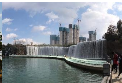
สวนน้ำตก Kunming Waterfall Park