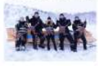
สนุกกับกิจกรรมจับปูยักษ์

DAY6 คีร์กเคเนส (บินภายใน) 00.00 น. ออกเดินทางสู่ เมืองคีร์กเคเนส โดยสายการบิน...เที่ยวบินที่... 00.00 น. เดินทางถึงสนามบินเมืองคีร์กเคเนส