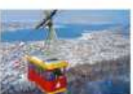
Tromso Cable Car

** ที่พัก CLARION HOTEL THE EDGE OR SIMILAR **