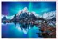
หมู่เกาะโลโฟเทน

DAY3 เลกเนส (บินภายใน)-หมู่เกาะโลโฟเทน 00.00 น. ออกเดินทางสู่ เมืองเลกเนส โดยสายการบิน Scandinavian Airlines เที่ยวบินที่ SK 4106 และเปลี่ยนเครื่องที่เมือง Bodo เป็นสายการบิน Wide roe WF 810 00.00 น. เดินทางถึงสนามบินเมืองเลกเนส