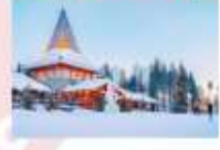
หมู่บ้านซานต้าครอส

DAY9 โรวาเนียมี (ฟินแลนด์)-อิสตันบูล (ตุรกี)