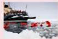
ล่องเรือตัดน้ำแข็ง Ice Breaker

DAY8 เคมี-ล่องเรือตัดน้ำแข็ง-ไอซ์เบรกเกอร์