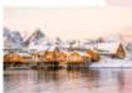
หมู่บ้าน Sakrisoy