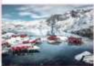
หมู่บ้าน Nusfjord

** พักที่ ELIASSEN RORBUER OR SIMILAR **