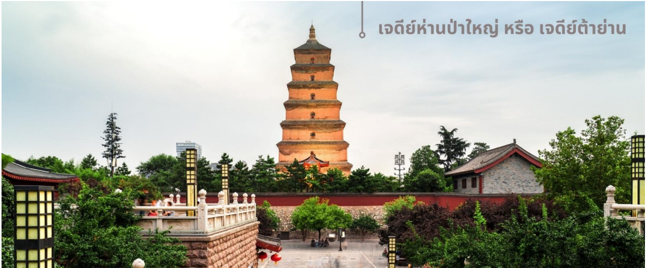
เจดีย์ห่านป่าใหญ่ หรือ เจดีย์ต้ายาน

จากนั้นนำท่านเที่ยวชม เจดีย์ห่านป่าใหญ่ หรือ เจดีย์ต้ายาน สถานที่ท่องเที่ยวระดับ 4A อายุมากกว่า 1,300 ปี ตั้งอยู่ในบริเวณวัดต้าฉือเอิน ซึ่งเป็นวัดสำคัญที่พระถังซำจั๋งเคยพำนัก ในตอนใต้ของเมืองซีอาน มณฑลฉ่านซี ตัวเจดีย์สร้างขึ้นใน ค.ศ.652 ในสมัยราชวงศ์ถัง โดยพระถังซำจั๋ง(หรือพระเสวียนจ่าง) ได้เสนอให้สร้างขึ้นเพื่อเก็บพระคัมภีร์และวัตถุที่ได้นำกลับมาจากชมพูทวีปในช่วงการเดินทางไปแสวงบุญที่อินเดีย เจดีย์ห่านป่าใหญ่มีความสูงประมาณ 64 เมตรในปัจจุบัน หลังผ่านการบูรณะและปรับปรุงหลายครั้ง โครงสร้างของเจดีย์ทำจากอิฐและมีการออกแบบที่เรียบง่ายแต่สง่างาม แสดงถึงสถาปัตยกรรมสมัยราชวงศ์ถัง แต่ด้วยเหตุแผ่นดินไหวในเวลาต่อมา บางส่วนของเจดีย์ถล่มลง ทำให้ปัจจุบันเหลือเพียง 7 ชั้นเท่านั้น ส่วนที่มาของชื่อเจดีย์ ตำนานเล่าว่ามีพระสงฆ์ในกลุ่มหนึ่งที่นับถือลัทธิแบบมหายาน เคยขาดแคลนอาหารอย่างหนัก วันหนึ่งพระสงฆ์เห็นฝูงห่านป่าบินผ่าน สงฆ์บางคนอธิษฐานต่อพระพุทธเจ้าให้พวกเขาได้รับอาหารเพียงพอสำหรับดำรงชีวิต ทันใดนั้น ห่านป่าตัวหนึ่งตกลงมาจากท้องฟ้าชนเข้ากับเจดีย์ ถึงแก่ความตาย เหล่าพระสงฆ์เชื่อว่าเป็นการสละร่างให้เป็นอาหาร จึงเชื่อกันว่าห่านตัวนั้นคือสัญลักษณ์ของพระเมตตา บ้างก็ว่าห่านตัวนั้นคือพระโพธิสัตว์ จึงสร้างเจดีย์ขึ้นเพื่อแสดงความขอบคุณและเป็นที่ระลึก เหตุการณ์นี้กลายเป็นที่มาของชื่อ "เจดีย์ห่านป่าใหญ่" เพื่อสะท้อนถึงปาฏิหาริย์และความศรัทธาในพระพุทธศาสนา