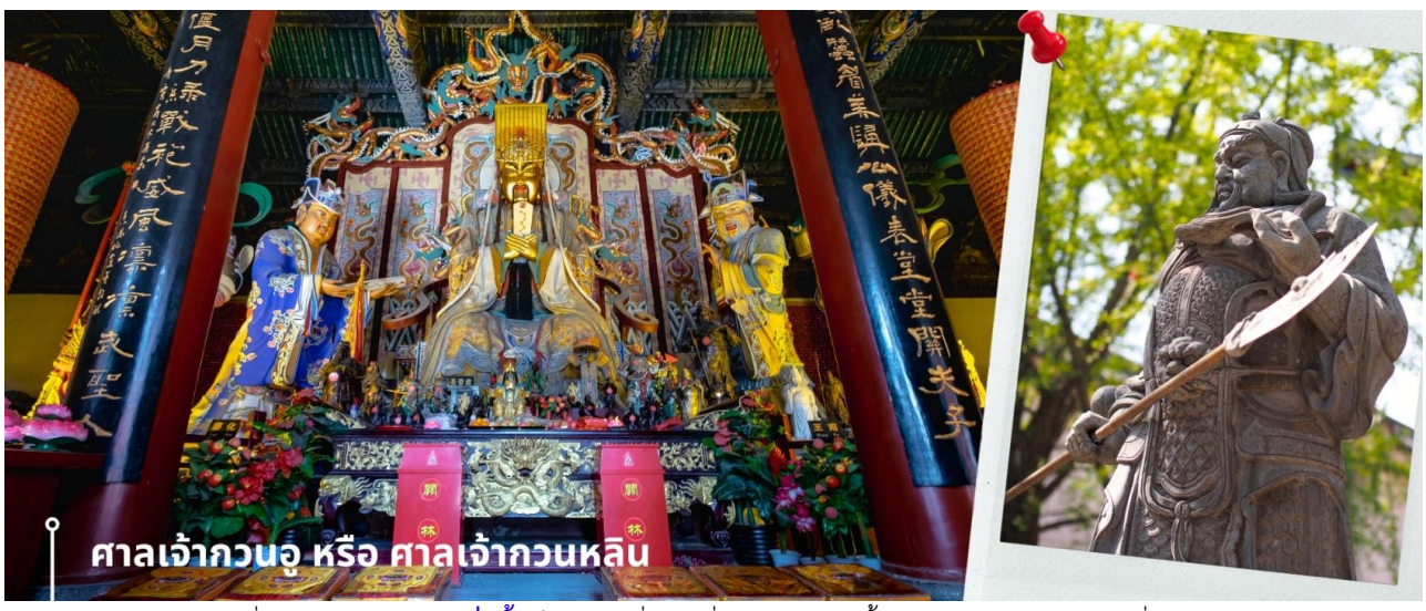
ศาลเจ้ากวนอู หรือ ศาลเจ้ากวนหลิน

CZHYCU1 ซีอาน ลั่วหยาง วัดเส้าหลิน สุสานจิ้นซี วัดลามะ 6วัน 5คืน ZH เซินเจิ้นแอร์ไลน์