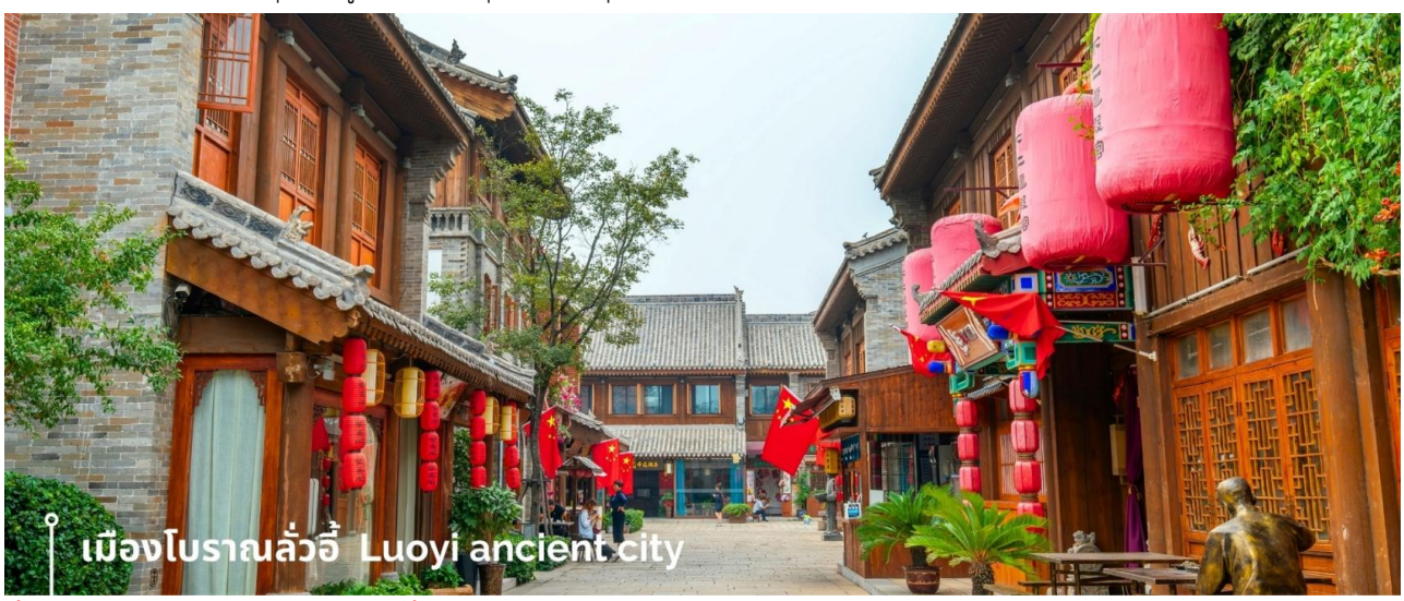
เมืองโบราณลั่วอี้ Luoyi ancient city

นำท่านเที่ยวชม เมืองโบราณลั่วอี้ เป็นสถานที่ท่องเที่ยวระดับ 1A ตั้งอยู่ในเมืองเก่าของเมืองลั่วหยาง เมืองหลวงโบราณของราชวงศ์ทั้ง 13 ราชวงศ์ บรรยากาครอบอวลไปด้วยเสน่ห์แบบจีนโบราณ ที่ยังคงอยู่มายาวนานหลายร้อยปี เมื่อเดินเล่นผ่านเมืองโบราณลั่วอี้ จะเห็นสถาปัตยกรรมบ้านเรือน ที่มีชายคาซ้อนกันเป็นชั้นๆ และกำแพงเมือง สนามหญ้าโบราณ ให้ทุกท่านรู้สึกราวกับหลุดเข้าไปในยุคจีน โบราณ