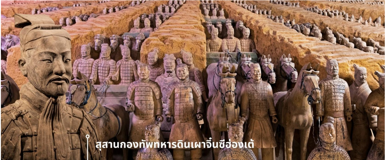
สุสานกองทัพทหารดินเผาฉินซีของเต๋

เผาอีกกว่า 600 ตัว พร้อมรถม้า และอาวุธต่าง ๆ ความน่าทึ่งอีกอย่างก็คือ ทหารดินเผาแต่ละตัวถูกปั้นขึ้นขึ้นด้วยมือและมีรายละเอียดแตกต่างกันไป เช่น สีหน้า ทรงผม และเครื่องแต่งกาย ซึ่งสะท้อนยศและบทบาทของแต่ละคนในกองทัพ รวมถึงการเคลือบสีเพื่อให้รูปปั้นคงทนยาวนาน ซึ่งในปัจจุบัน สุสานแห่งนี้มีขนาดใหญ่ พื้นที่มากกว่า 56 ตารางกิโลเมตร ยังมีหลุมฝังศพหลัก และหลุมย่อยอีกมากมายที่ยังไม่ได้ถูกขุดค้น