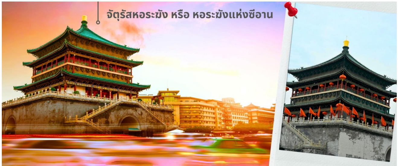
จัตุรัสหอร่มัง หรือ หอร่มังแห่งซีอาน

จากนั้นนำท่านเดินทางเที่ยวชม จัตุรัสหอร่มัง หรือ หอร่มังแห่งซีอาน เป็นหนึ่งในสัญลักษณ์สำคัญของเมืองซีอาน ตั้งอยู่ใจกลางเมือง สร้างขึ้นในปี ค.ศ. 1384 สมัยราชวงศ์หมิง เพื่อใช้ประกาศเวลาและเตือนภัยจากศัตรู ตัวหอสร้างจากไม้ทั้งหมด มีความสูงประมาณ 36 เมตร โดดเด่นด้วยสถาปัตยกรรมจีนโบราณที่งดงาม และการประดับด้วยลวดลายสีทองและเขียว จัตุรัสแห่งนี้เป็นจุดตัดของถนนสายหลักทั้งสี่สาย สามารถขึ้นไปชมวิวเมืองซีอานแบบพาโนรามาได้ด้านบน นอกจากนี้ ภายในยังมีนิทรรศการเกี่ยวกับประวัติศาสตร์และวัฒนธรรมของหอร่มังให้ได้ชมอีกด้วย