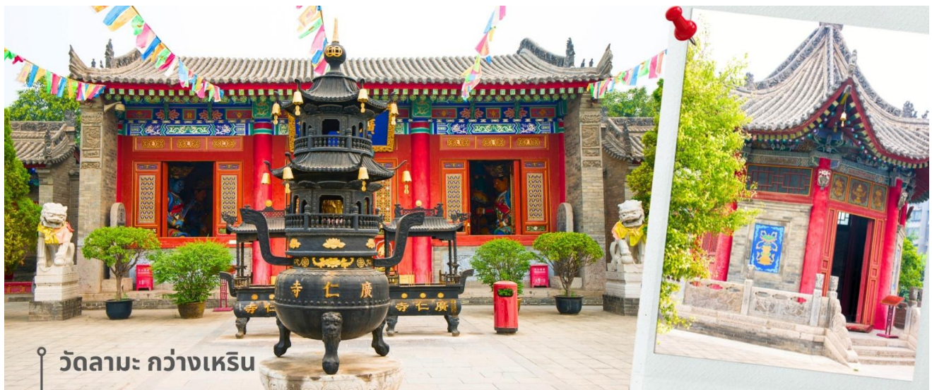
วัดลามะ กว่างเหริน

CZHYCU1 ซีอาน ลั่วหยาง วัดเส้าหลิน สุสานจิ้นซี วัดลามะ 6วัน 5คืน ZH เซินเจิ้นแอร์ไลน์