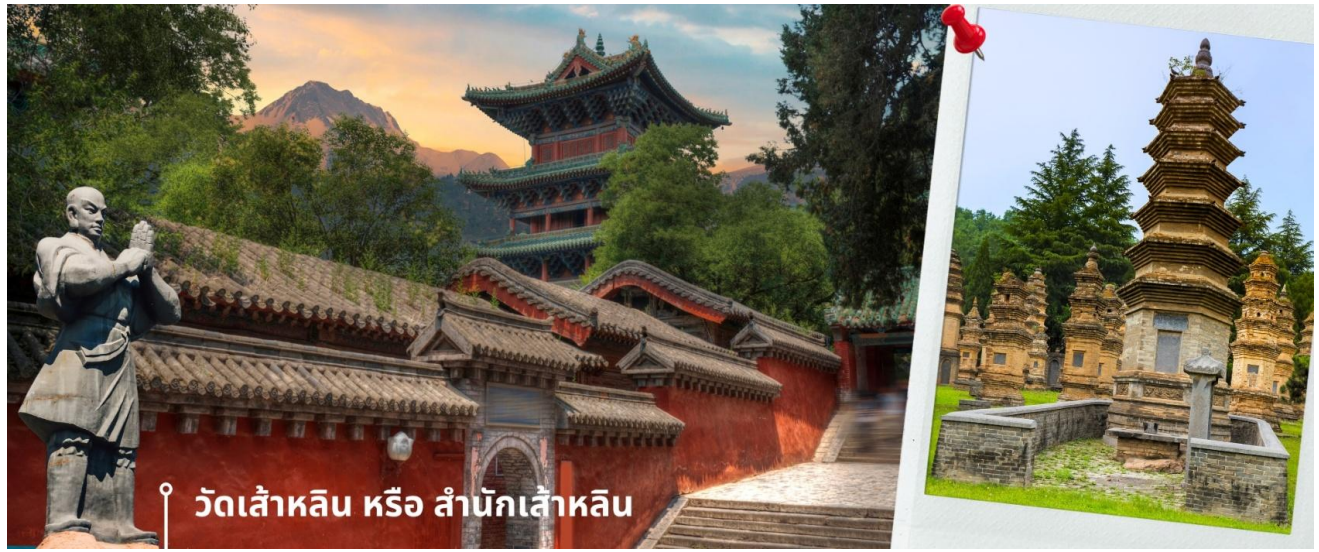
วัดเส้าหลิน หรือ สำนักเส้าหลิน

ของนักแสดง ซึ่งทุกคนล้วนถูกฝึกปรืออย่างหนัก กว่าที่จะออกมาเป็นโจรสลุดยอดวิชา จนถึงขั้นที่ว่ากังฟูของสำนักเส้าหลิน ได้รับการยกย่องให้เป็นมรดกทางวัฒนธรรมที่จับต้องไม่ได้ของจีน