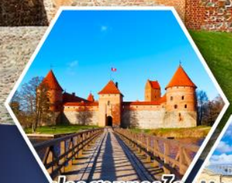
ปราสาททรานด์