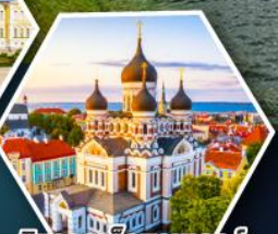
วิหารอเล็กซานเดอร์ แอฟสกี (ทาลลินน์)

• ล่องเรือซิลยาไลน์ข้าม จากเอสโทเนียสู่ฟินแลนด์ • เข้าชมโบสถ์หิน Rock Church