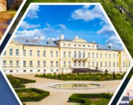
พระราชวังรินดกาล